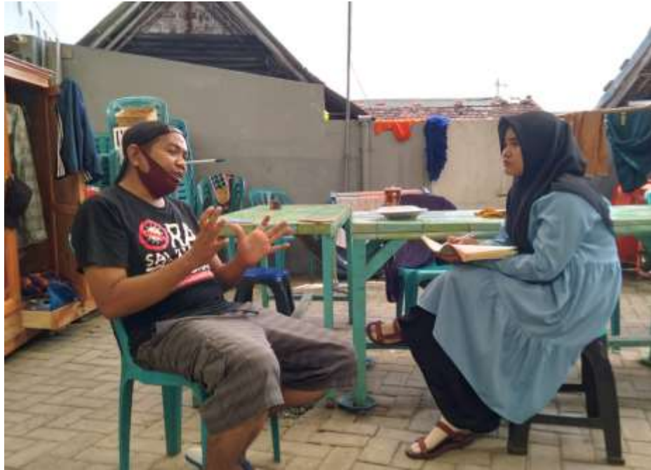
(wawancara dengan bapak sulistyono)