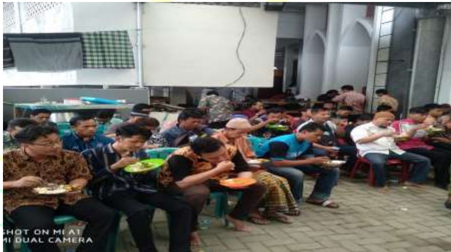
Kegiatan makan Prasmanan Setelah Sholat Jum'at