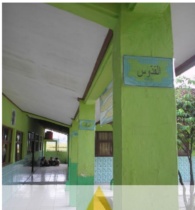
Poster Asma'ul Khusna