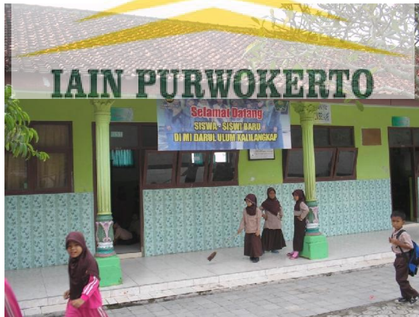
Pembiasaan datang tepat waktu