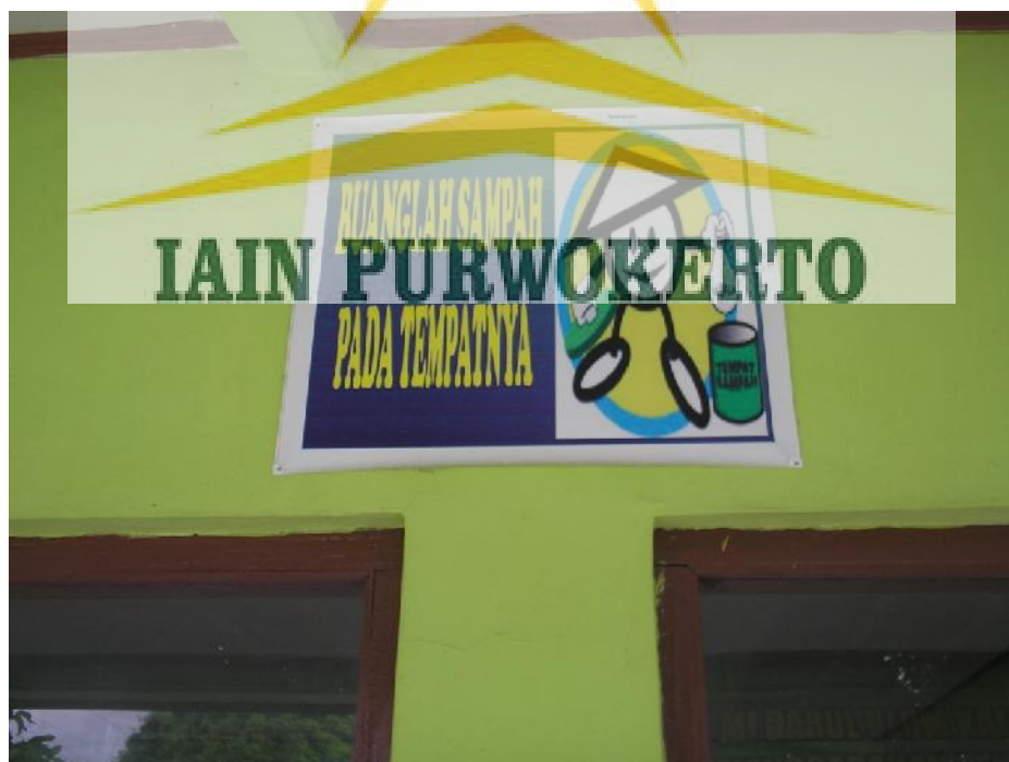
Poster “buanglah sampah pada tempatnya”