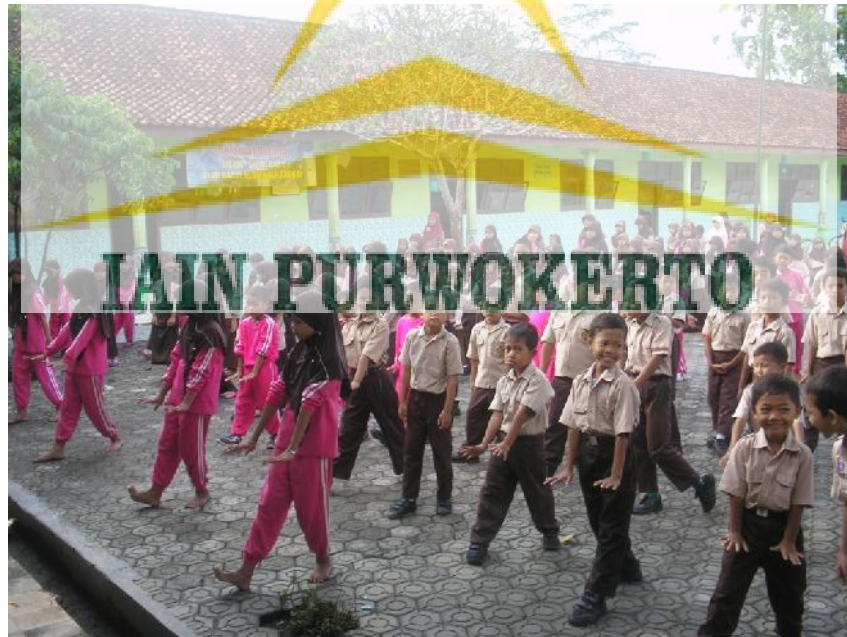
Pelaksanaan olahraga bersama