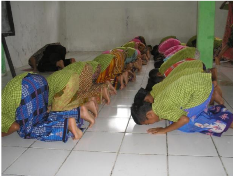
Pelaksanaan jamaah shalat dzuhur