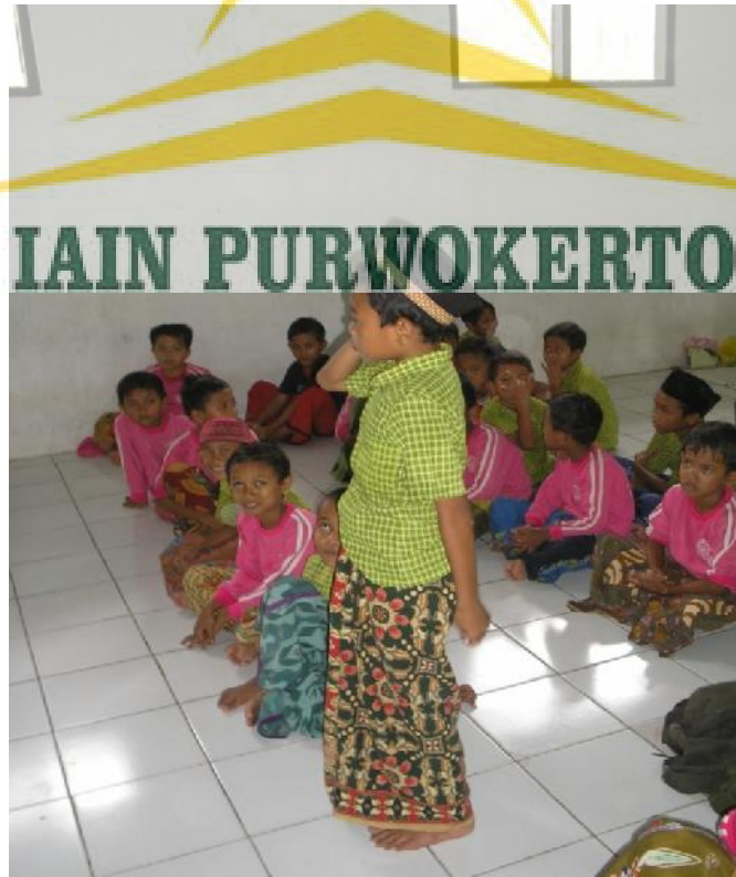
Iqamat pada pelaksanaan jamaah shalat dzuhur