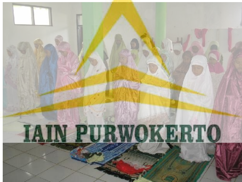
Pelaksanaan jamaah shalat dhuha