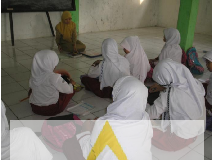
Pelaksanaan do'a pra belajar