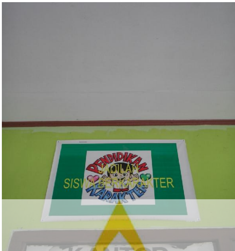
Poster “jadilah siswa berkarakter”