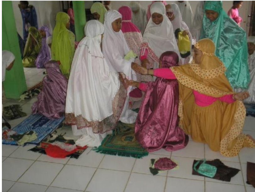
Bersalaman setelah shalat jamaah