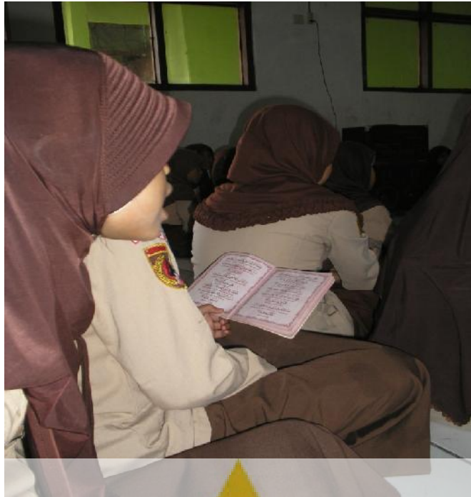
Pembacaan surah yasin berjamaah