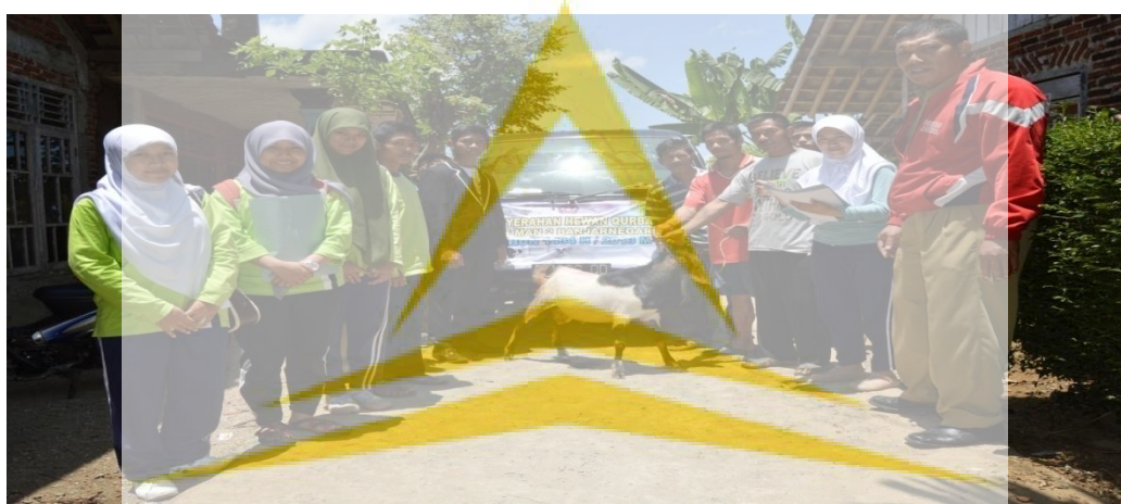
IAIN PURWOKERTO Pendistribusian hewan Qurban