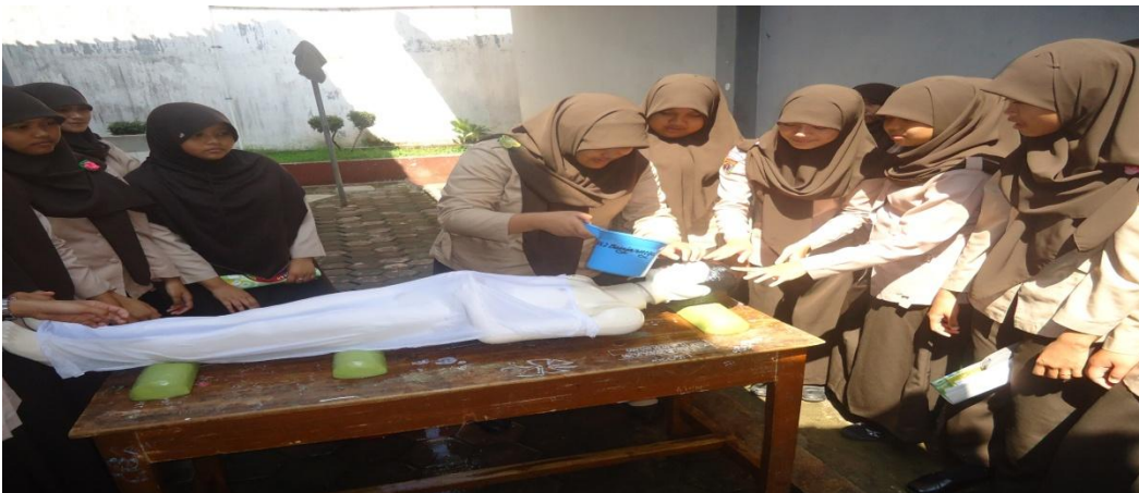
Training Mengurus Jenazah