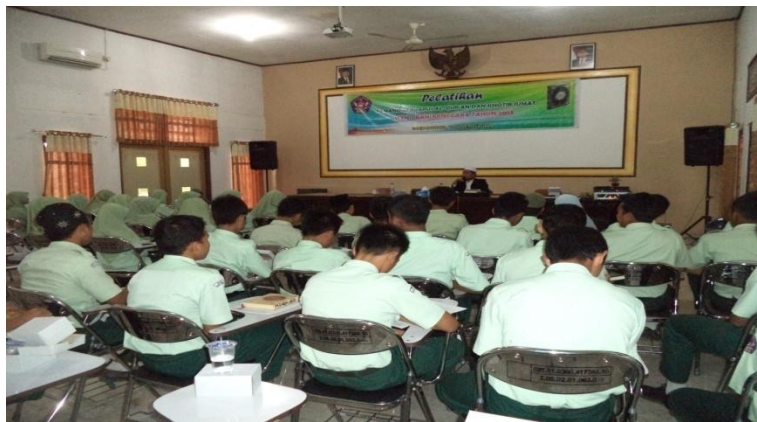
Pelatihan pemandu tadarus Al-Qur'an dan khotib Jum'at