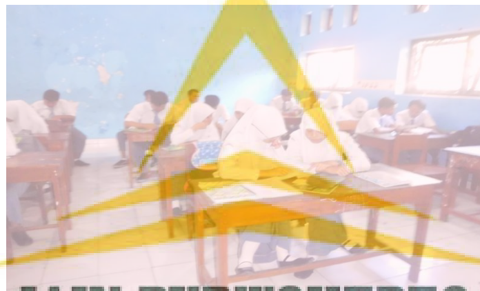
IAIN PURWOKERTO Tadarus Al-Qur'an sebelum jam pelajaran pertama