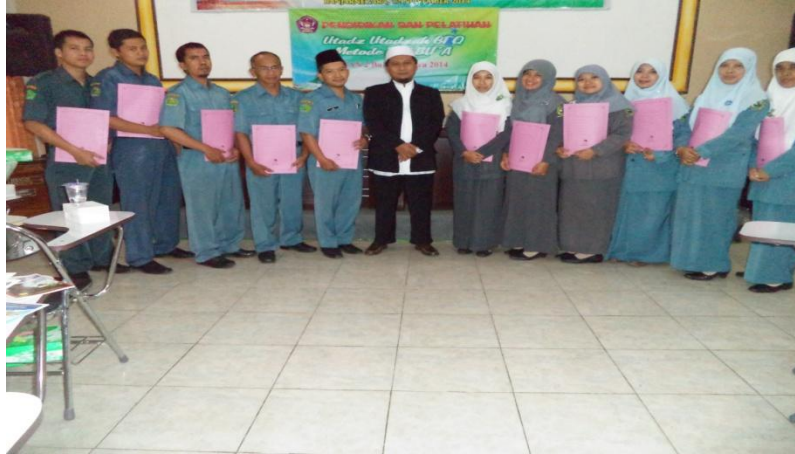
Pendidikan dan pelatihan ustadz ustadzah BTQ metode Yanbu'a