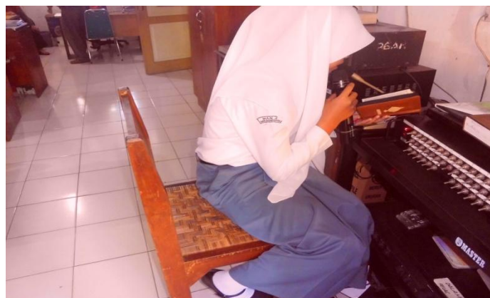
Siswa yang bertugas menjadi pemandu tadarus Al-Qur'an