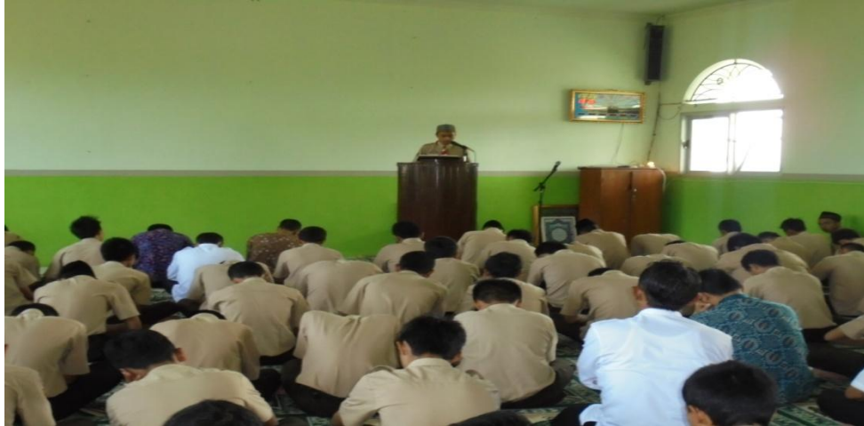
Siswa yang bertugas menjadi khotib Jum'at