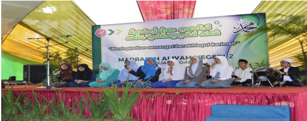
Peringatan Maulid Nabi SAW