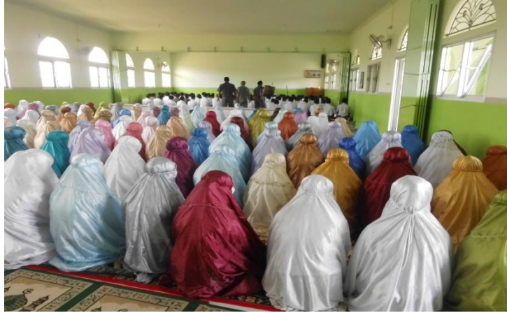
Shalat Dzuhur berjamaah