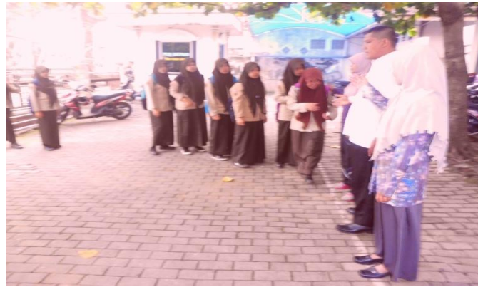
Para siswa memberi salam dan berjabat tangan dengan guru