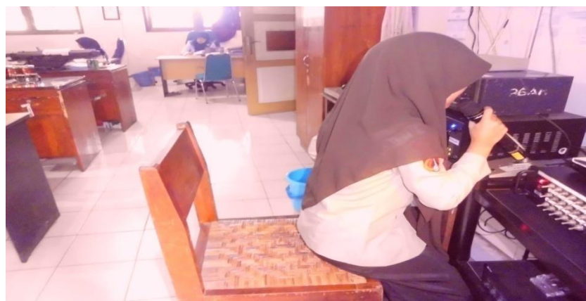
Siswa yang bertugas menjadi pemandu Asmaul Husna