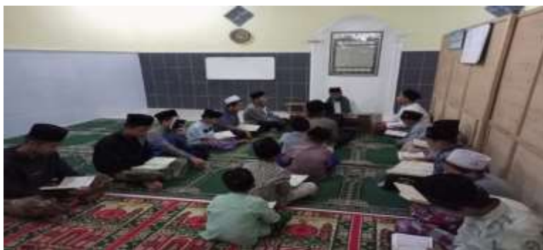
Gambar5 'Kegiatan Setoran Talaqqi Dengan Pengasuh