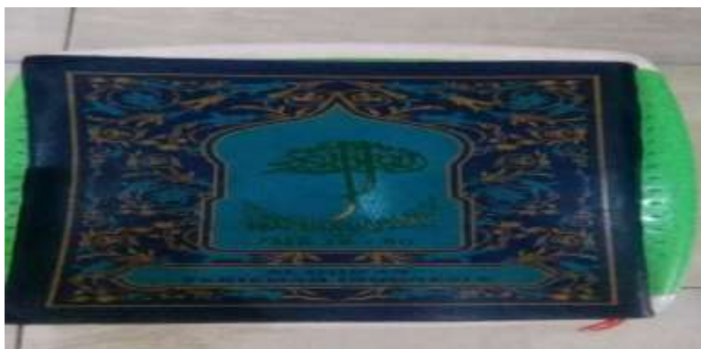
Gambar 6 Mushaf Al-Qur'an punya Santri Dawuhan Wetan