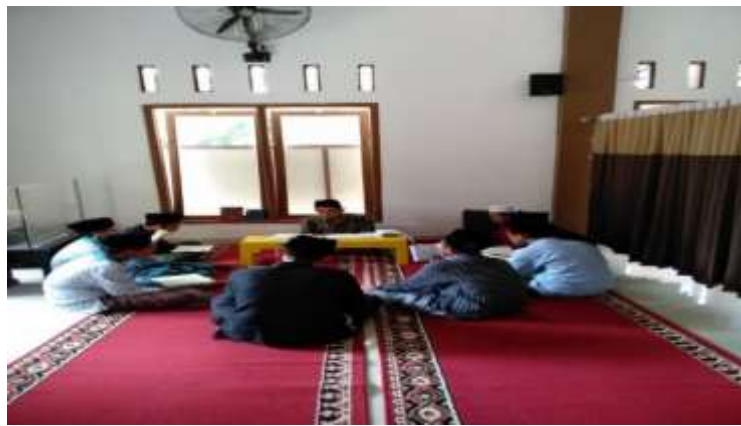
Gambar 3 Kegiatan Pembelajaran Talaqqi Dengan Ust Pedamping