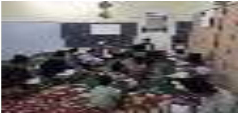
Gambara kegiatan talaqqi Santri Darul Qur'an Dawuhan Wetan