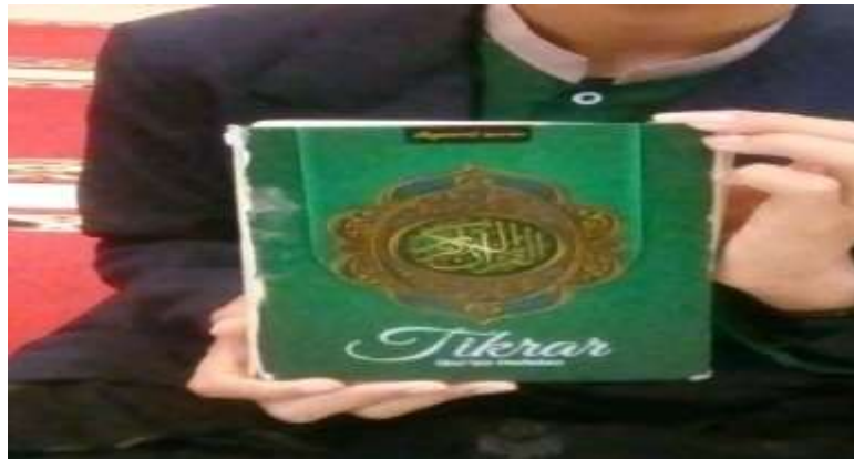
Gambar1 Mushaf Tkrar Pondok Darul Qur'an Al-Karim

disaat melakukan pembelajaran menghafal al-Qur'ān menggunakan mushaf tkrar . Hal ini sudah ditentukan oleh Bpk pengasuh pondok pesantren darul al-Qur'ān al-Karim. Dimana mushaf al-Qur'ān ini adalah mushaf yang khusus untuk menghafal al-Qur'ān dengan ciri-ciri warna kertas agak kuning dan juga mushaf ini mudah untuk dihafalkan oleh santri. Al-Qur'ān tkrar ini cetakan oleh PT sigma gramedia arkan 5 jalan babakan sari no 71 diarah condong Bandung 4083. Berikut gambar mushaf al-Qur'ān yang digunakan oleh santri darul Qur'ān al-Karim.