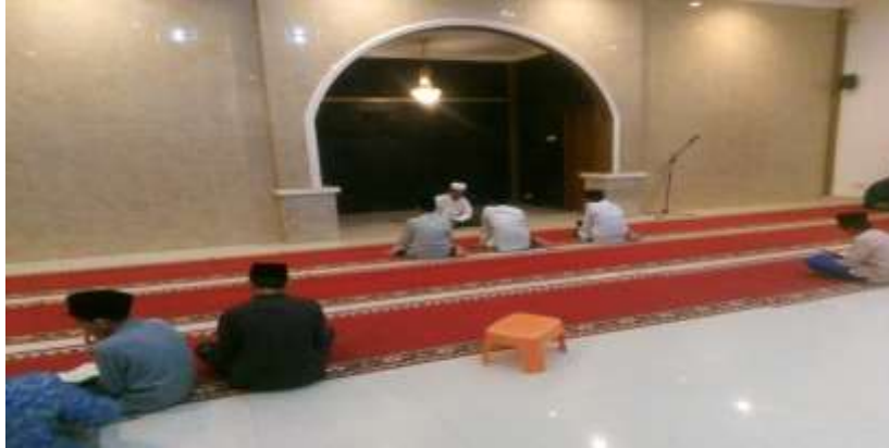
Gambar kegiatan Talaqqi Darurul Qur'an Al-Karim