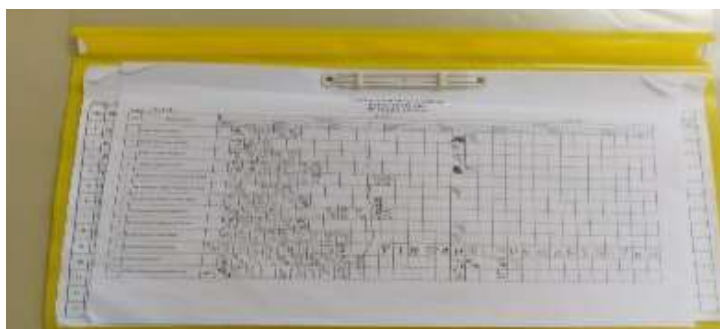
Gambar 4 Daftar Evaluasi Setoran Tahfidz Pondok Darul Qur'an Al-Karim 129

Evaluasi Unggulan yaitu santri ini memiliki kecerdasan yang sangat luar biasa sehingga santri bisa menghafal al-Qur'ān secara cepat, oleh karena itu santri yang lebih unggul atau santri bisa mengafal al-Qur'ān secara cepat maka secepatnya cegeza usul kepada pengasuh atau Ustaz pendampinya untuk segera disimak atau diuji. Adapun waktu pelaksanaan simakan atau ujian harus memiliki waktu yang khusus agar lebih fokus terhadap kegiatan simakan atau ujian.