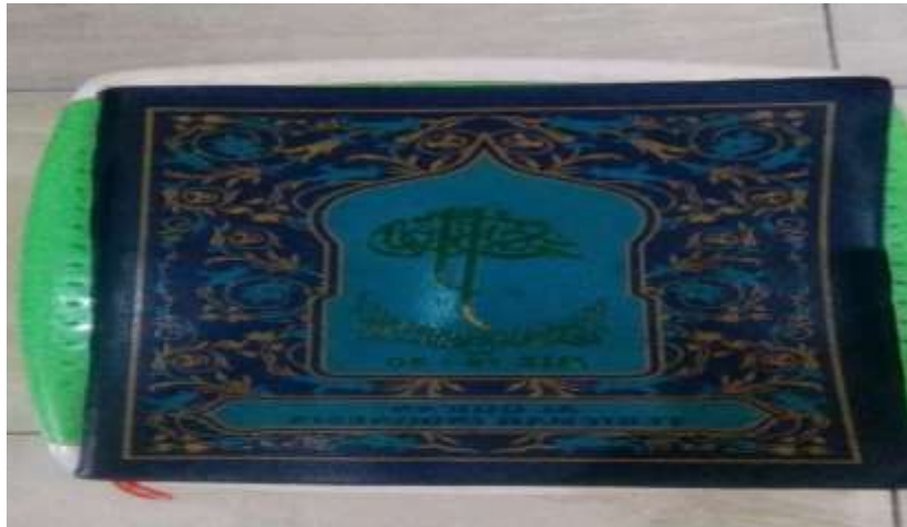
Gambar: Al-Qur'an Yang di Pakai Santri Darul Qur'an Dawuhan