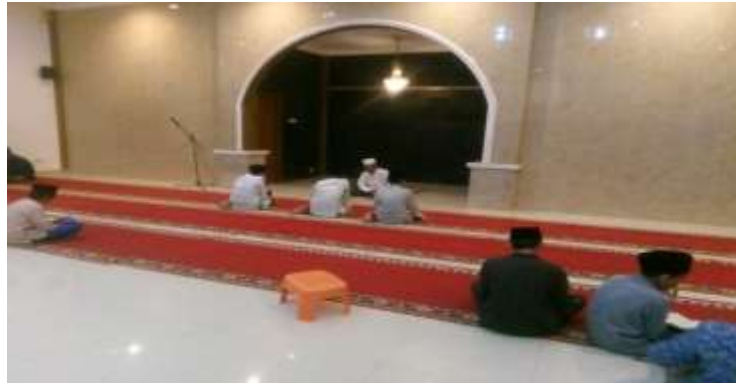
Gambar 2 Pembelajaran Talaqqi dengan Pengasuh