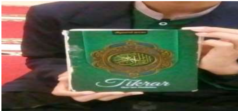
Gambar Al-Qur'an Yang di Pakai Santri Darul Qur'an Al-Karim