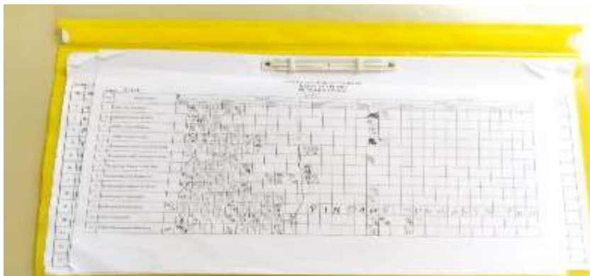
Gambar Buku Penilaian Santri Darul Qur'an Al-Karim