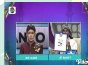
Gambar 9 150