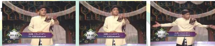
Gambar 14 156

Seperti kata “ternyata” yang diucapkan dengan huruf “r” yang tebal “terrnyata”, serta menggunakan nada sedikit tinggi, dan ritme yang pelan. Kemudian kata “nyatater” yang ia ucapkan secara terpisah dan sedikit jeda “nya-ta-ter”, lalu kata “jebule” yang di ucapkan dengan aksan medhok khas bahasa Jawa ngapak. Serta kata “cempuleke” yang di ucapkan dengan cara mengucapkan huruf “u” sedikit lebih panjang dan menggunakan nada tinggi ke rendah