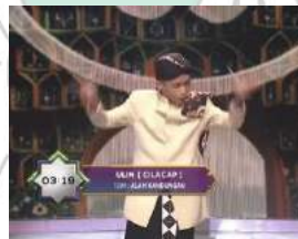
Gambar 17 159