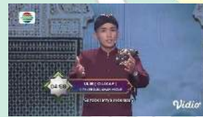
Gambar 2 141