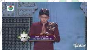
Gambar 3 142