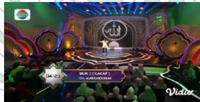
Gambar 12 154

Contohnya adalah ketika ia menggunakan kata bahasa Jawa “Sedulur” yang apabila diartikan kedalam bahasa Indonesia memiliki makna “Saudara”. Kata-kata tersebut ia gabungkan dengan nama kompetisi yang ia ikuti yaitu kompetisi AKSI Indosiar, sehingga tercipta kata “Sedulur AKSI” yang maknanya adalah saudara-saudara AKSI. Kemudian ia juga menggunakan kata bahasa Jawa “Nun” yang merupakan sebuah kata yang digunakan masyarakat Jawa ketika namanya di panggil. Dengan terciptanya istilah-istilah tersebut membuat interaksi antara Ustadz Ulin Nuha dengan mad'unya terjaga dengan baik.