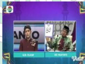
Gambar 8 149