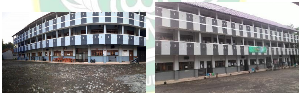
Gedung SMP Islam Andalusia Kebasen Banyumas tampak Samping dalam.