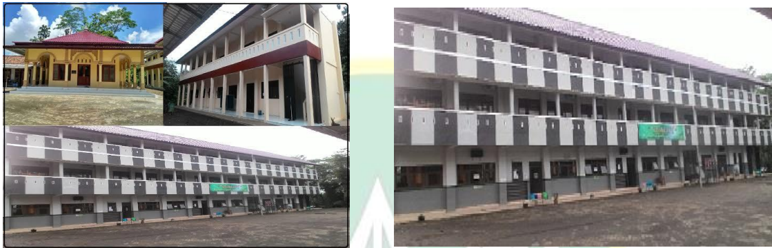
Gedung SMP Islam Andalusia Kebasen Banyumas tampak dari dalam.