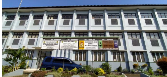
Gedung SMP Islam Andalusia Kebasen Banyumas.