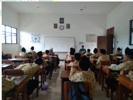
Dokumentasi observasi dikelas VII saat pembelajaran Bahasa Arab di SMP Islam Andalusia Kebasen Banyumas.