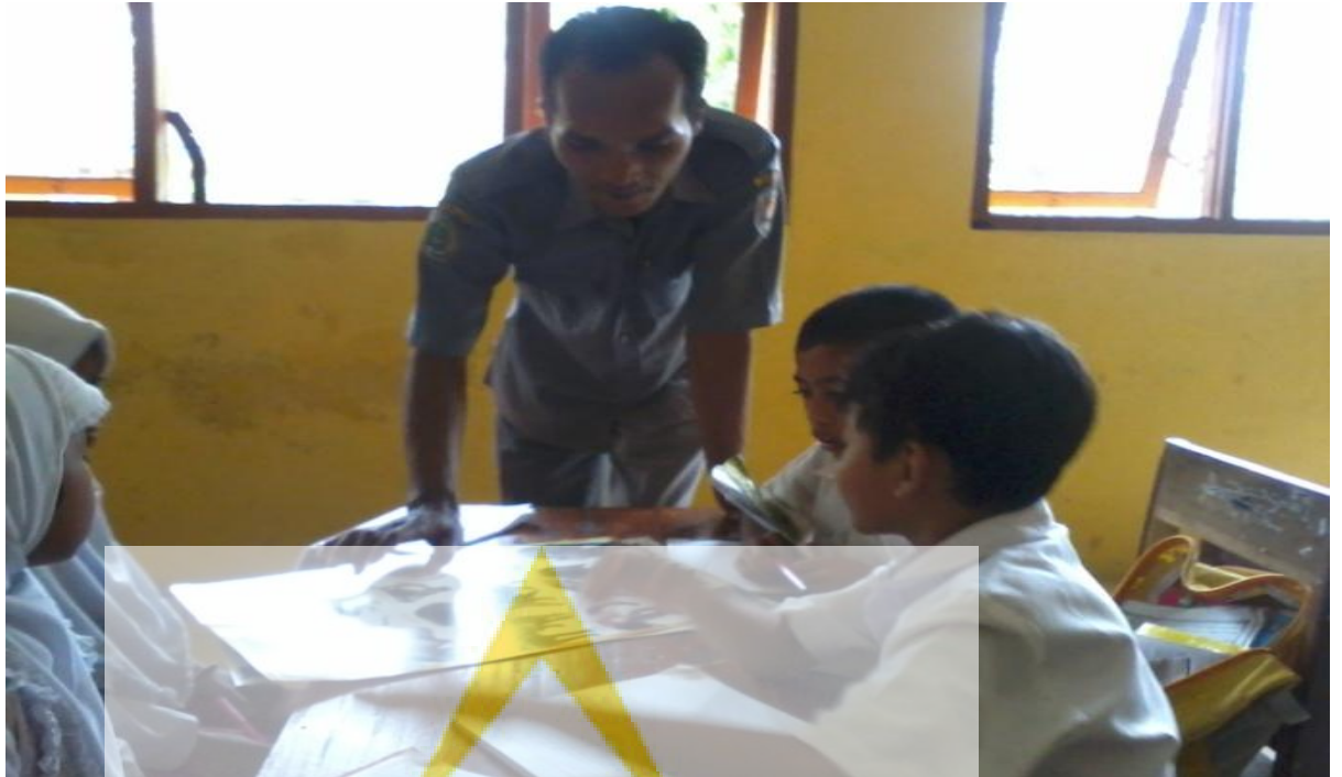
Gambar 3. Guru sedang member bimbingan kesalah satu kelompok