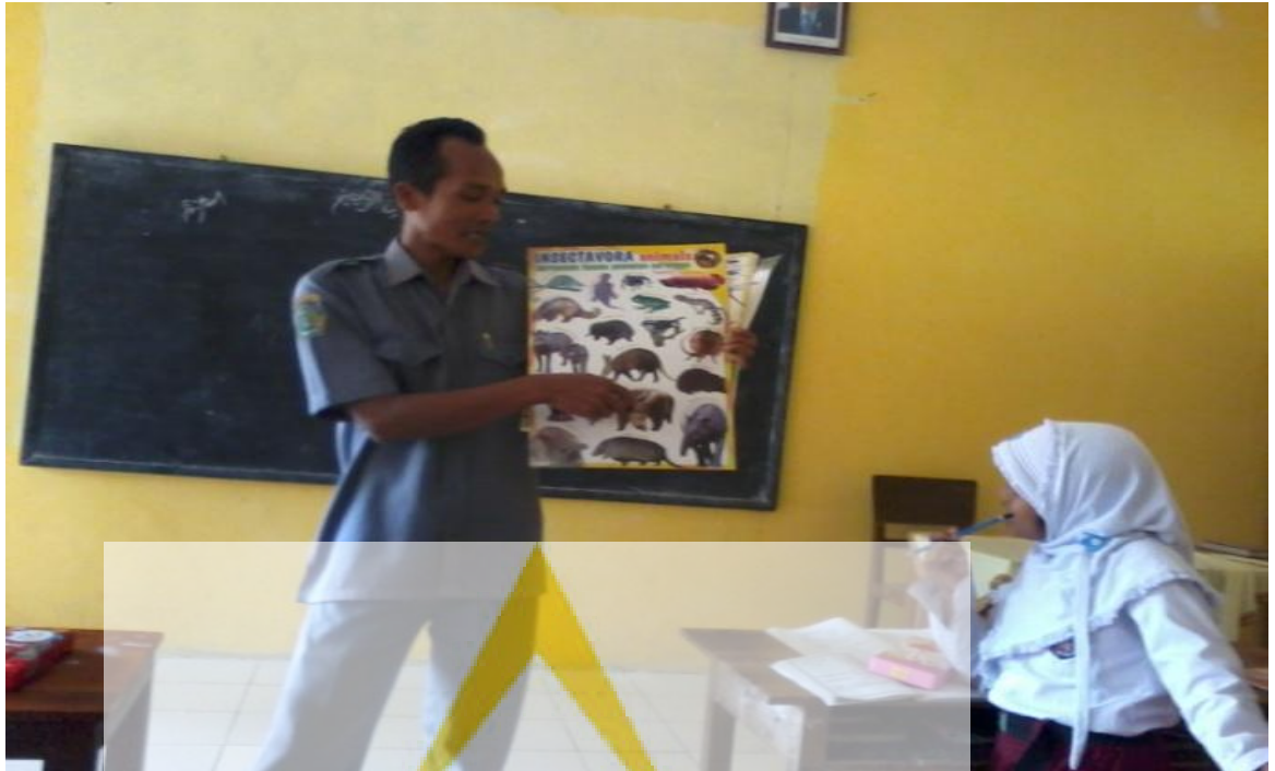
Gambar 1. Guru sedang menjelaskan materi penggolongan hewan dengan menggunakan media gambar