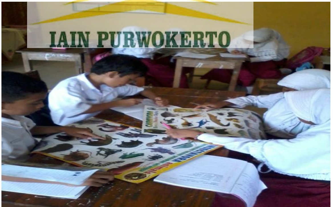
Gbr 2. Siswa sedang antusias mengerjakan tugas kelompok