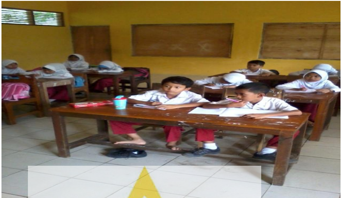
Gambar 6. Siswa terlihat antusias mendengarkan Temanya sedang membacakan hasil diskus