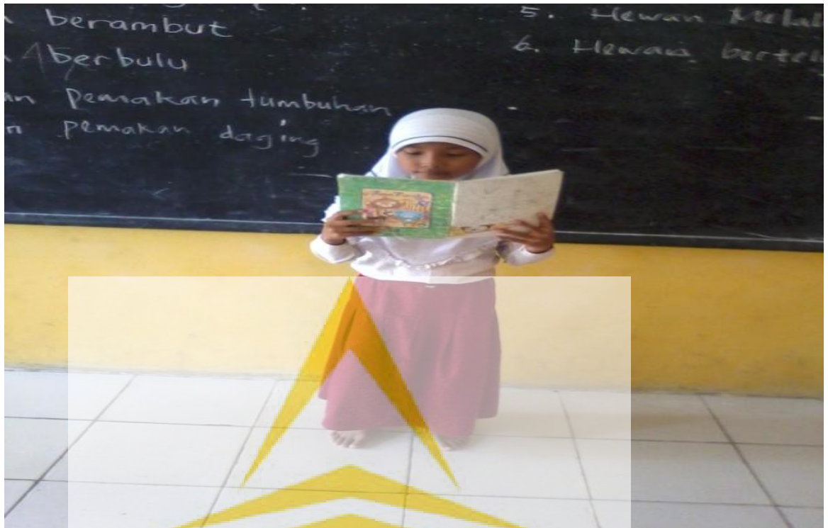
Gambar 5. Salah satu kelompok sedang membacakan hasil kelompoknya di depan kelas

Gbr 3. Guru/Peneliti sedang memberi bimbingan kepada siswa mengenai cara menggolongkan hewan dengan media gambar.