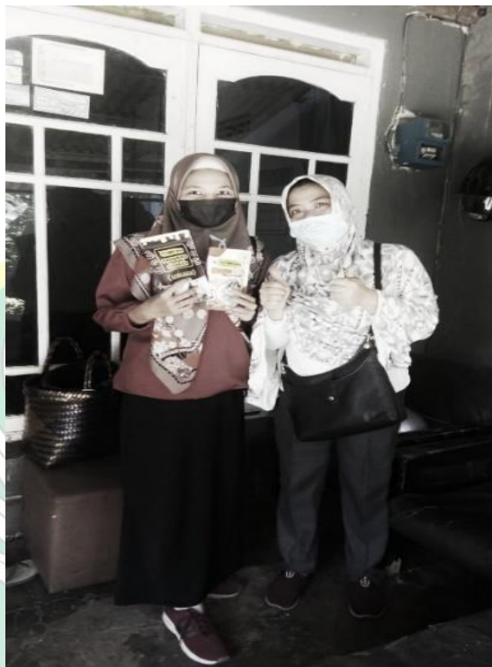
Gambar 4.1: Observasi ke tempat Penelitian

tertentu harga bahan baku mengalami peningkatan yang cukup drastis dan masih banyaknya masyarakat yang belum mengetahui produk brownies tempe Madame Mbois namun dengan strategi-strategi yang disusun sedemikian rupa hingga akhirnya sanggup bertahan dan mengembangkan usahanya.