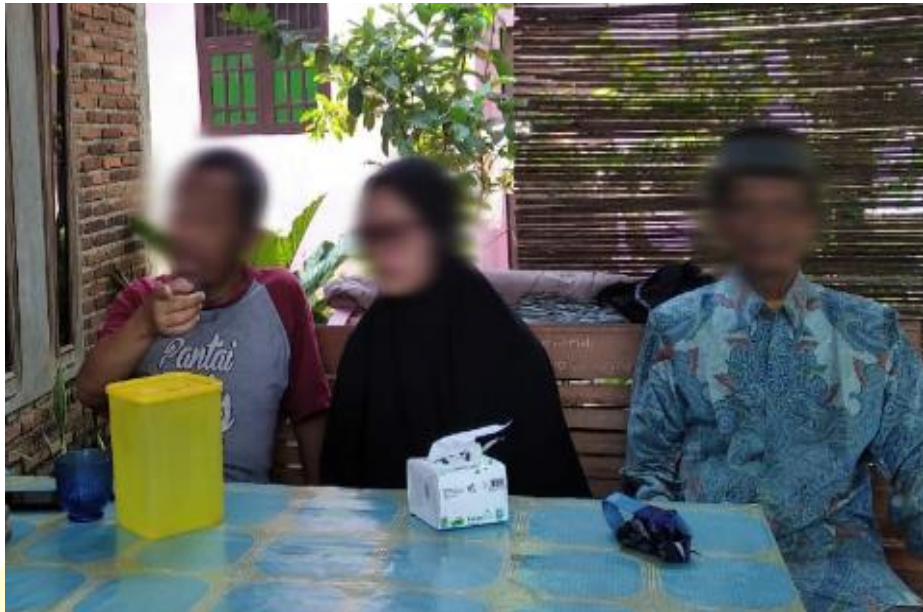
Gambar 4.1. Pak WA dan istri kedua bersama orang tua istri kedua

Gambar di atas adalah pak WA dan istri kedua ditemani orang tua dari istri kedua pak WA. Pak WA memilih untuk tinggal bersama istri kedua di rumah yang terpisah dengan istri pertama (bu ES). Keputusan tersebut dilakukan karena istri pertama sibuk dengan profesinya sebagai pengacara, sehingga jika suami ikut dengan istri pertama kurang mendapat perhatian karena pak WA sekarang sering sakit-sakitan sehingga perlu perhatian yang lebih dan istri kedua dapat memenuhi kebutuhannya tersebut. Namun demikian kehidupan kedua istrinya tetap harmonis, walaupun jarang bertemu dengan istri pertama hubungan tetap terjalin dengan baik, walau terkadang hanya berkomunikasi melalui media sosial tetapi hubungan mereka tetap baik demi kebaikan anak-anak.