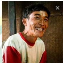
Gambar 1.4 Tokoh Ayah Arifin

Ayah Arifin merupakan ayah yang pekerja keras, pantang menyerah dan selalu berusaha untuk memenuhi kebutuhan keluarganya, termasuk juga sekolah Arifin. Ia yang selain bekerja diladang, juga menerima pekerjaan jika ada orang lain yang menawarkan pekerjaan di ladang. Selain itu, ia juga mencari rumput sebagai makanan hewan ternak yang dipeliharanya. Usahnya untuk memenuhi kebutuhan anak-anaknya terlihat saat Arifin lulus sekolah dan ingin melanjutkan sekolahnya di SMP N. ia mencari pinjaman uang kesana kemari meski dalam keadaan hujan deras. Namun uang yang terkumpul dari pinjaman ke tetangga belum cukup untuk Arifin melanjutkan ke SMPN. Sehingga Arifin melanjutkan sekolahnya ke sekolah pesantren.