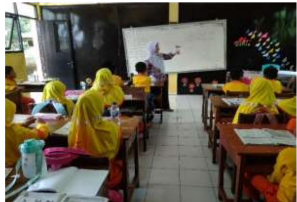
Obsevasi penggunaan media gambar di kelas 3 Al Kholiq