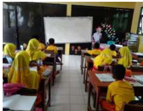
Observasi kelas 3 Al Mushowwir