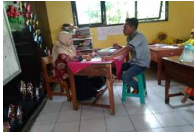
Wawancara wali kelas 3 sekaligus guru mapel Bahasa Arab