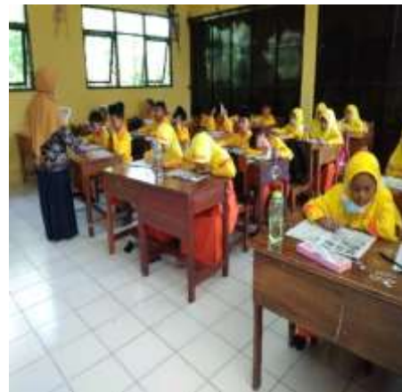
Observasi di kelas 3 Al Bari'