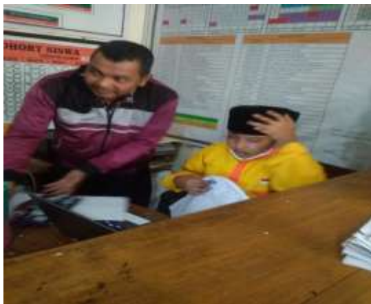
Wawancara kepada siswa yang di dampingi oleh guru