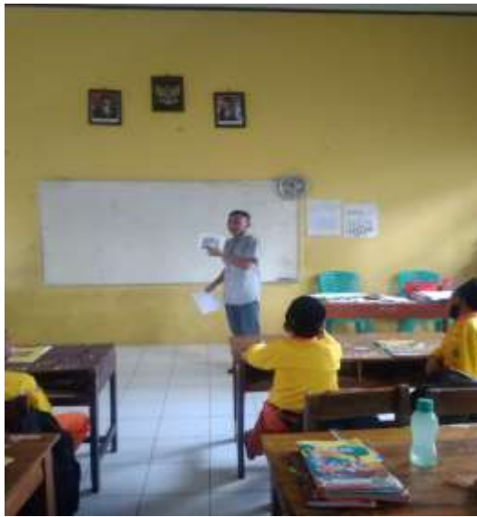
Evaluasi yang dilakukan oleh peneliti dengan menggunakan media gambar di kelas 3 Al Mutakabbir