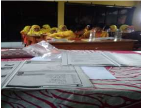
Observasi materi pelajaran Bahasa Arab kelas 3