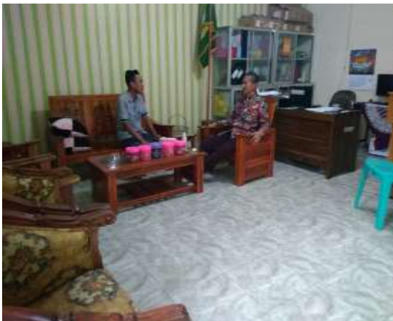
Wawancara kepala sekolah MIN 2 Banyumas