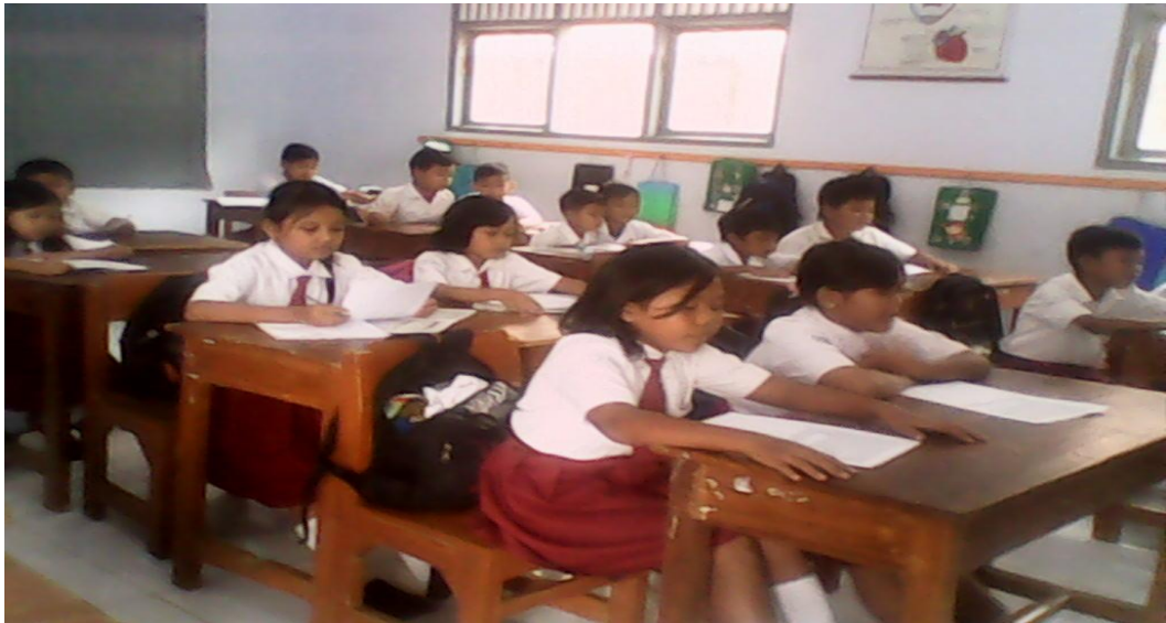
Gambar III Suasana pembelajaran PAI di kelas V SD Negeri 2 Cingebul dengan menggunakan Strategi Reading Guide