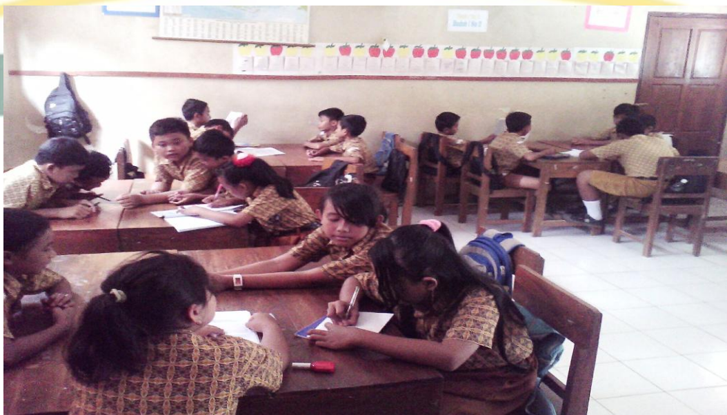
Gambar II Suasana pembelajaran di kelas VI SD Negeri 2 Cingebul dengan menggunakan strategi kooperatif