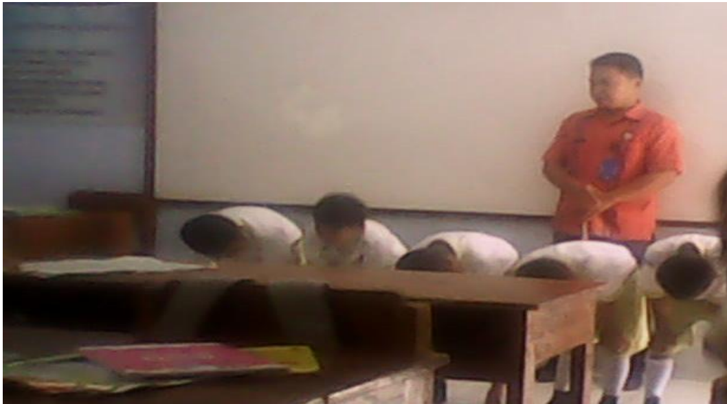
Gambar III Suasana pembelajaran PAI di kelas III SD Negeri 2 Cingebul dengan menggunakan Srtategi Modeling The Way