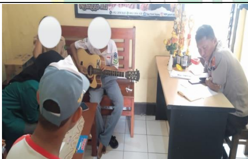
Kegiatan Follow Up menggali bakat anak