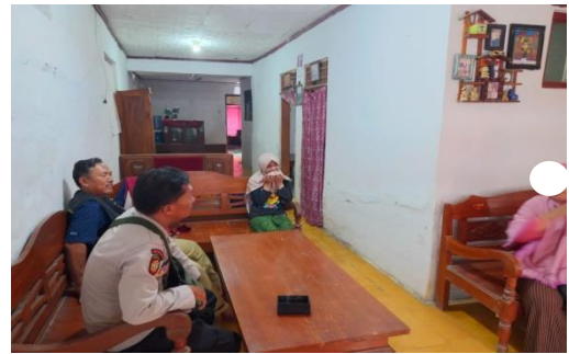
Kegiatan Home Visit