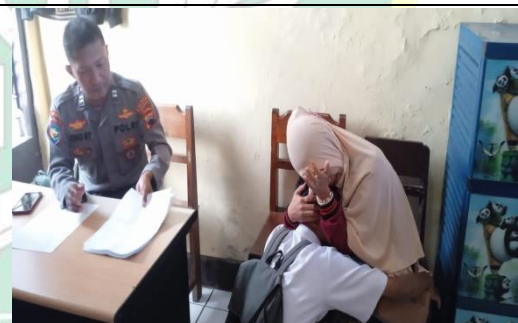
Mediasi Anak dan Orang Tua