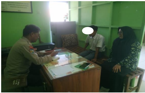
Konseling individu dengan pendampingan guru BK