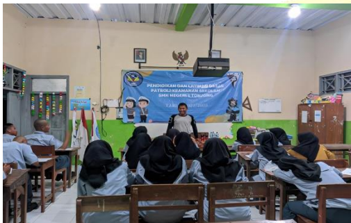
Bimbingan Klasikal dengan penyuluhan pada kegiatan sekolah