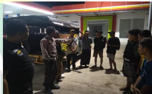
Kegiatan Patroli Malam