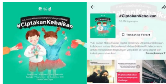
Gambar 1. Bentuk Campaign #CiptakanKebaikan

inspirasi dan edukatif sehingga akan terciptak komunitas yang suportif dan meningkatkan kesadaran akan pentingnya menciptakan kebaikan dan melawan perilaku negatif di ruang digital (wartaekomoni.co.id, 2021).