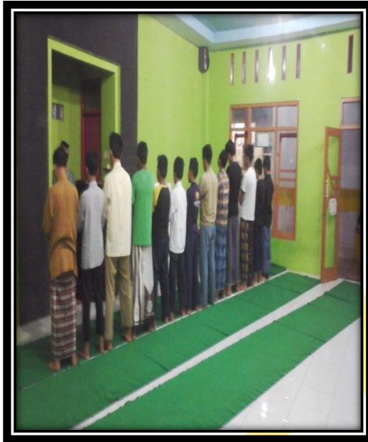
Sholat jama'ah asrama putra