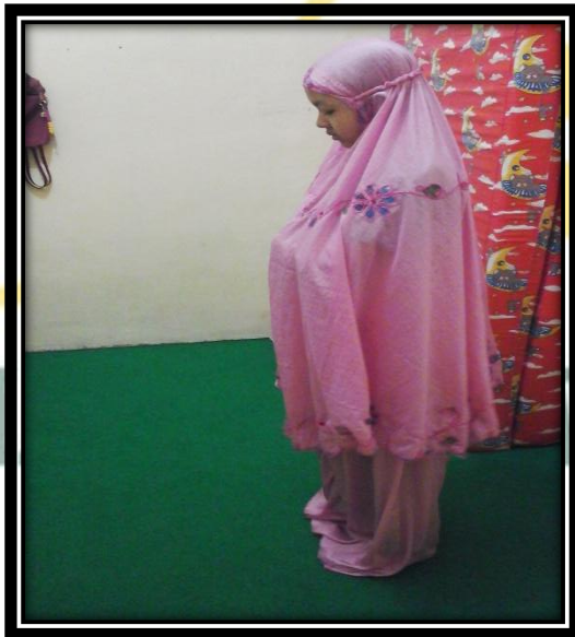
Sholat dhuha sebelum berangkat sekolah