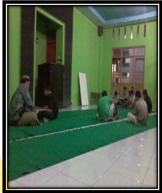
Tadarus dengan pengasuh asrama putra