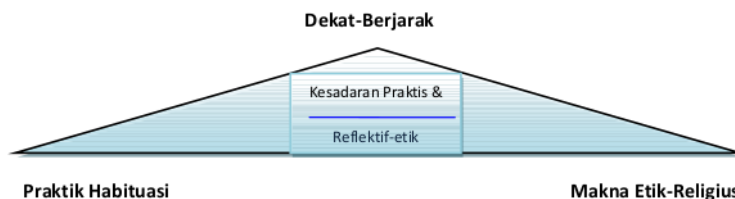
Gambar 1: Konfigurasi Hubungan Antar Elemen Utama Pembentuk Komunikasi Etik-Pedagogis

Dalam skema tersebut terlihat beroperasinya teori habituasi Bourdieu didukung strukturasi Giddens dan panoptikonisasi Foucault dengan nuansa khas pesantren. Lapisan terluar berupa 1 performansi komunikasi kiai-santri yang dekat-berjarak; yakni dekat karena emosi kekeluargaan primordial dan berjarak karena kedudukan dan hirarkhi sosial. Kesadaran praktis berpadu dengan kesadaran reflektif-etik terbentuk dan sekaligus membentuk melalui praktik tradisi terus-menerus dalam sistem relasi sosial patronase religius. Melalui habituasi terus-menerus dalam durasi panjang dengan pemaknaan etik-religius sehingga terbentuk habitus komunikasi etik-pedagogis. Landasan etik-religius menyebabkan semua entitas dan proses dimaknai positif dan bahkan dianggap sebagai perilaku ideal yang bersumber dari batin masing-masing komuniti pesantren sebagai kerangka perilaku praktis ( habitus ) yang selalu direproduksi dan mereproduksi secara kolektif (Bourdieu, 2004: 8).