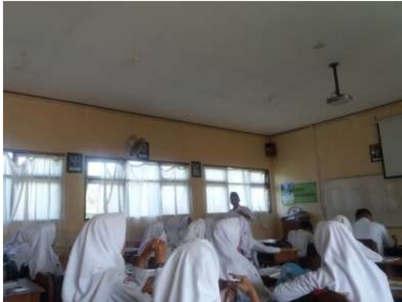
FOTO TENTANG MADRASAH ALIYAH NEGERI KROYA