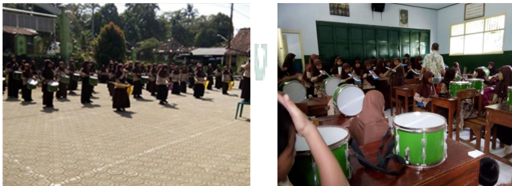
Gambar 2. Salah satu masyarakat sedang melatih Drum Band