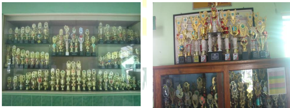
Gambar 8. Sebagian Piala Prestasi Siswa