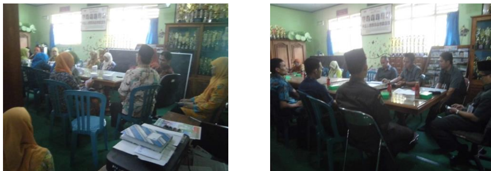
Gambar 9. Rapat dan evaluasi dengan guru TK