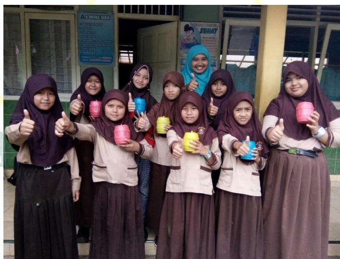
Gambar 6. Program GISMIPLIS (Gerakan Infak Sodaqoh Minimal Seribu rupiah)