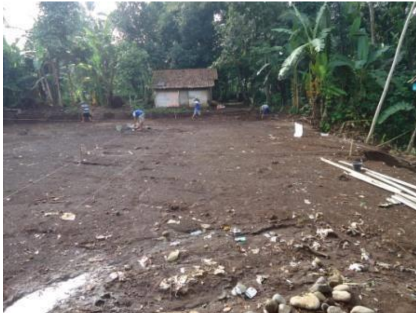
Gambar 17. Masyarakat bergotong – royong meratakan tanah untuk ruang kelas baru