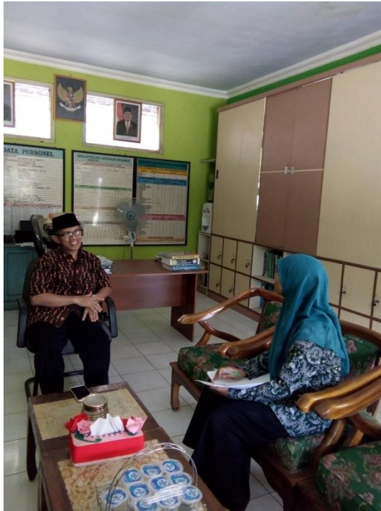
Gambar 1. Wawancara dengan Kepala MI Ma'arif NU 1 Pageraji