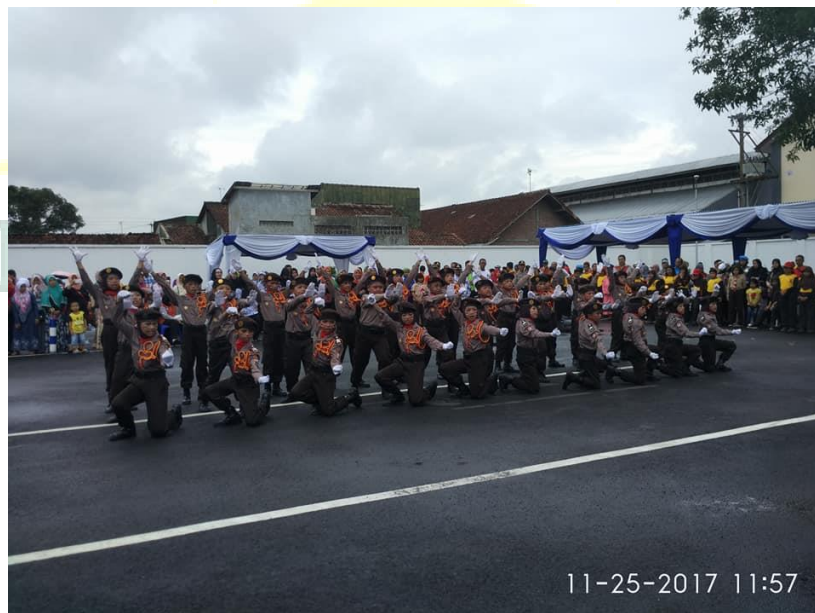
Gambar 18. Polisi Cilik (Pocil) MIMA Pageraji yang dibimbing oleh Polsek Cilongok