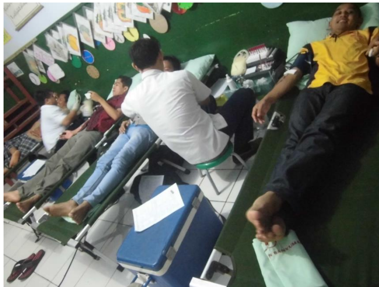
Gambar 7. Pelaksanaan Donor Darah bekerjasama dengan Ansor