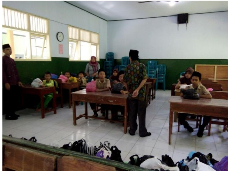
Gambar 3. Pelaksanaan zakat fitrah