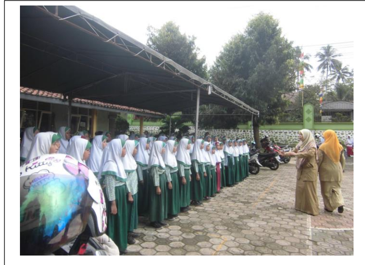
Gambar 11. Latihan paduan suara dengan pelatih dari wali murid