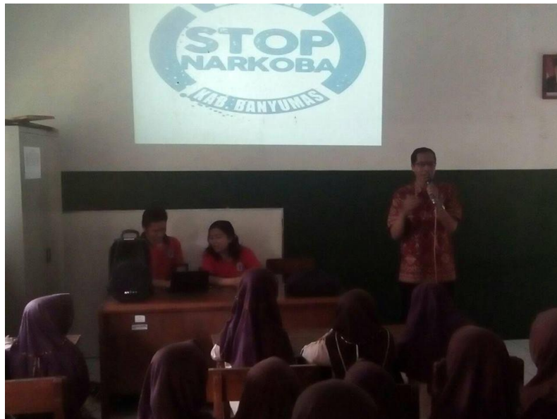
Gambar 15. Sosialisasi Narkoba oleh BNN