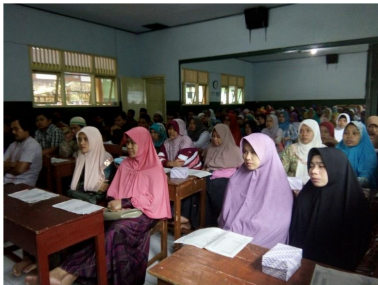
Gambar 5. Pengajian Rutin Wali murid Ahad Kliwon