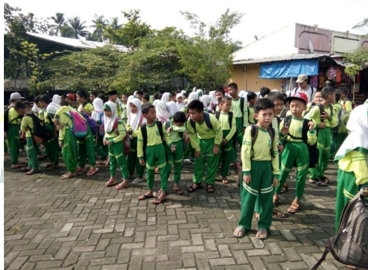
Gambar 4. Pelaksanaan outdoor study