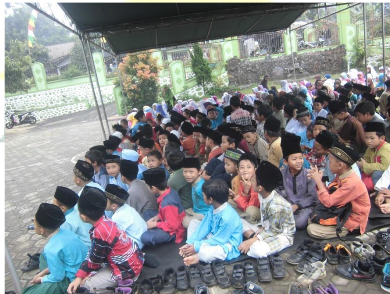
Gambar 12. Pelaksanaan Sholat Istisqa