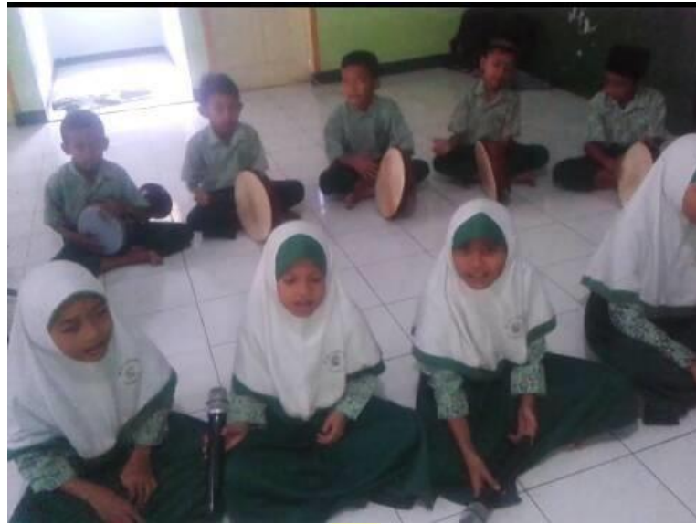
Gambar 13. Ekstrakurikuler Hadroh pembimbing dari masyarakat