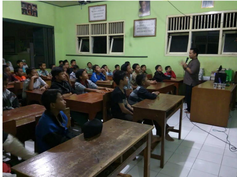
Gambar 14. Pengisian motivasi dari tokoh pemuda untuk menghadapi ujian sekolah