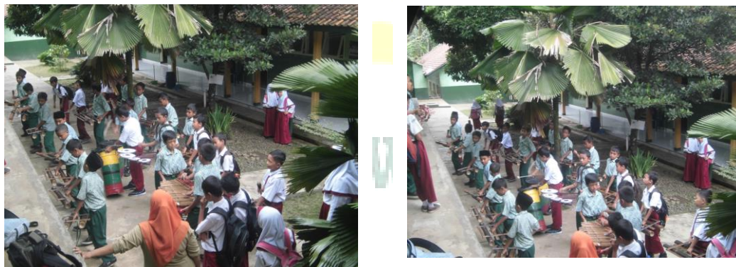
Gambar 10. Salah satu wali murid yang melatih kenthongan