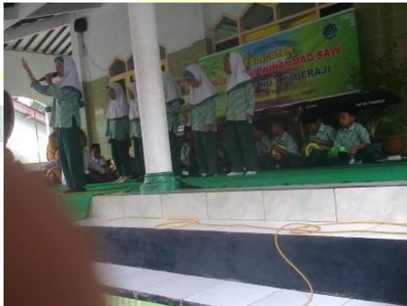
Gambar 16. Ikut mengisi acara di mawlid Nabi yang diadakan oleh masyarakat