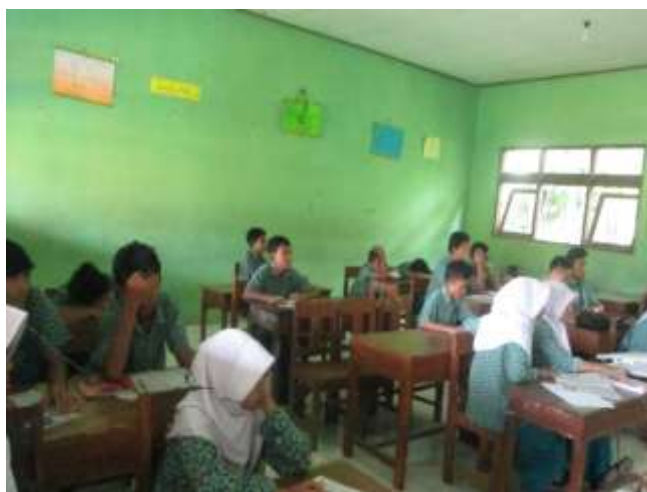
Para siswa kelas VIIIA sedang menyimak dan memperhatikan penjelasan materi dari guru terkait materi akhlak tercela dengki