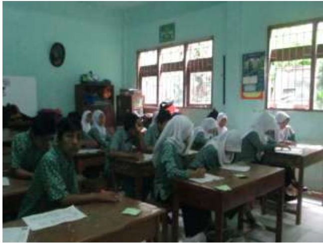
Para siswa kelas VIIA sedang memperhatikan dan mencatat penjelasan dari guru terkait materi tentang akhlak tercela riya'