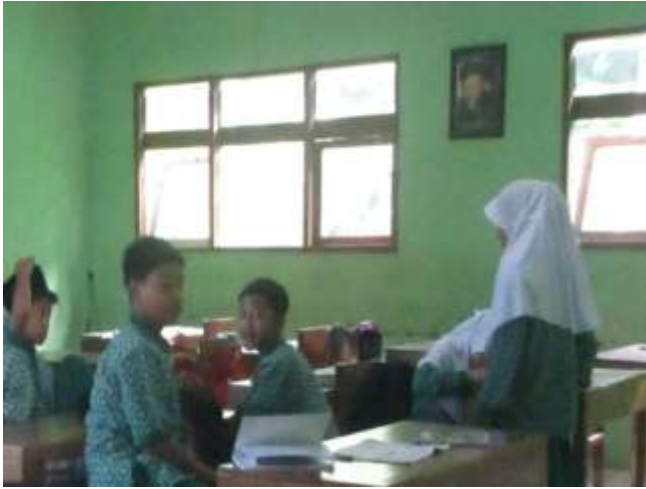
Para siswa VIIA sedang menempatkan diri membentuk kelompok untuk melakukan diskusi terkait materi akhlak tercela riya'