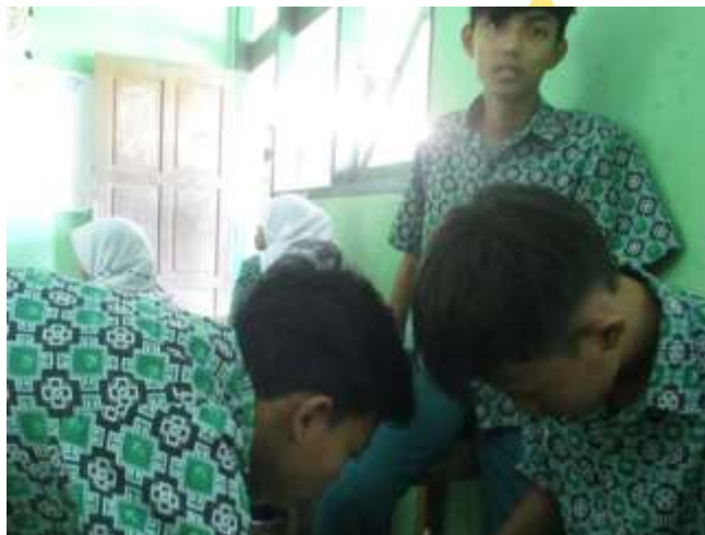
Para siswa VIIA sedang melakukan diskusi terkait materi akhlak tercela riya'