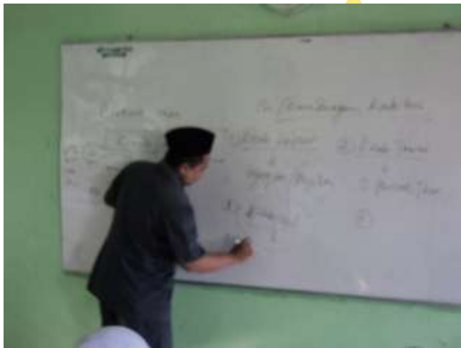
Guru menggunakan papan tulis untuk menulis pokok bahasan dan sub-sub bahasan materi akhlak tercela riya' agar lebih jelas dimengerti oleh para siswa