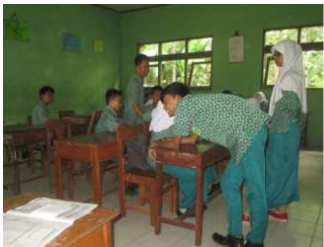
Salah satu perwakilan dari masing-masing kelompok di kelas VIIIB sedang mempresentasikan hasil diskusi terkait materi ghibah