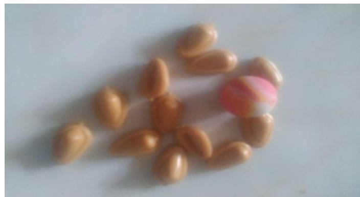
Gambar. Bola karet dan biji.

melakukan permainan bola bekel. Pada kegiatan inti pukul 08.00-09.00 anak-anak bermain bola bekel, pukul 09.00-09.30 istirahat, dan kegiatan penutup pukul 09.30-10.00 anak kembali ke kelas untuk makan dan minum, kemudian menanyakan hari ini telah melakukan kegiatan apa saja, dan menanyakan perasaan hari ini, selanjutnya berdoa pulang. Adapun langkah-langkah dan aturan bermain bola bekel, yaitu: