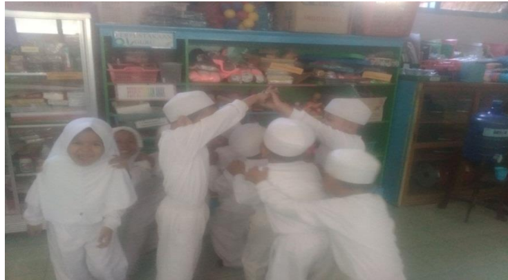
Gambar. Anak-anak berbaris sambil menyambung