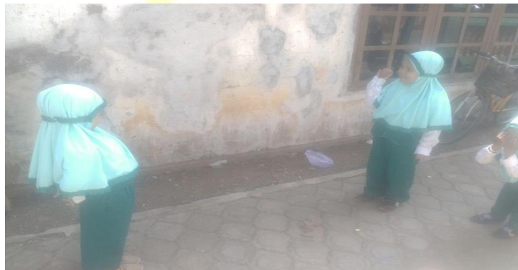
Gambar. Anak melempar bola ke lawan