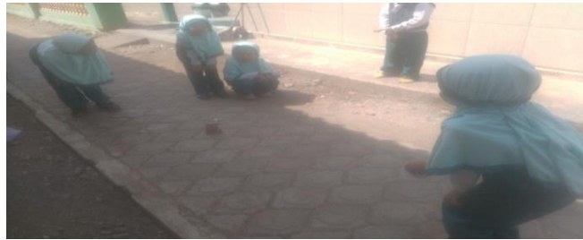
Gambar. Anak melempar pecahan genting dengan bola