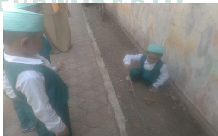
Gambar. Pemain memukul gatrik

Menyilangkan gatrik pendek di atas batu dan siap dilempar dengan gatrik panjang. Tim penangkap akan menjaga lemparan gatrik pendek, jika berhasil tertangkap maka giliran akan berganti. Jika tidak berhasil tertangkap maka giliran akan berganti. Jika masih tidak tertangkap masih ada satu kesempatan lagi dengan melempar gatrik pendek ke gatrik panjang. Apabila terkena, tim penangkap akan berganti menjadi tim pemukul.