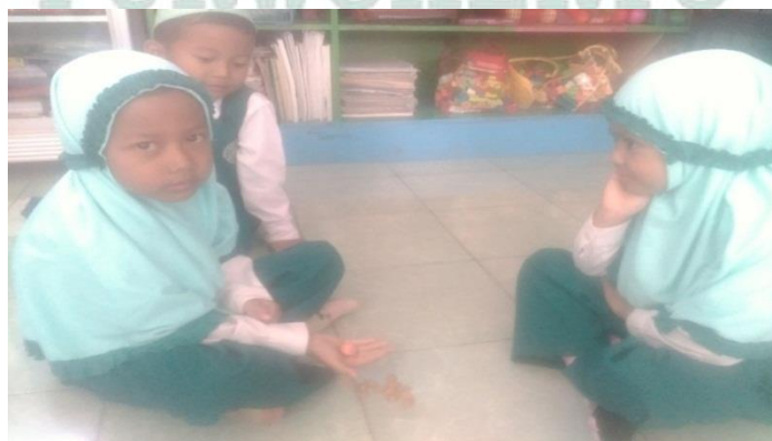
Gambar. Anak bermain bola bekel