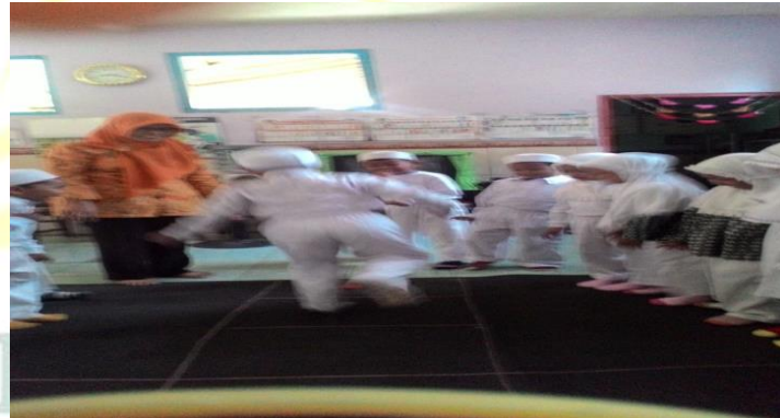
Gambar. anak melompat di petak