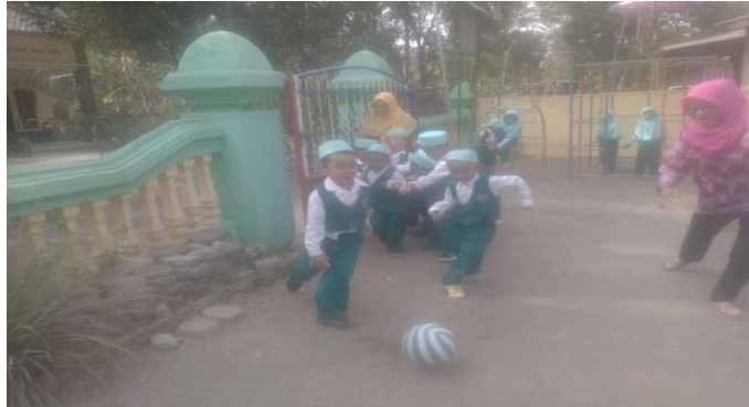
Gambar. Anak-anak sedang menggiring bola