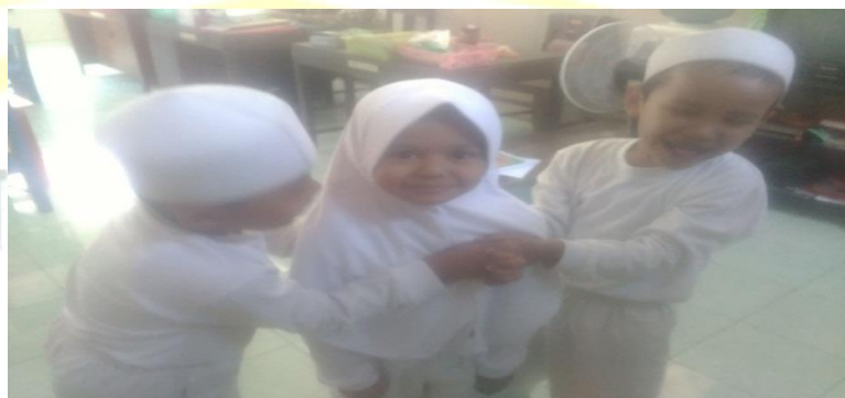
Gambar. Salah satu anak tertangkap