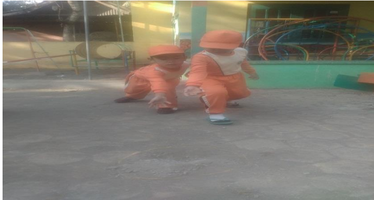
Gambar. Melempar kelereng agar masuk lubang