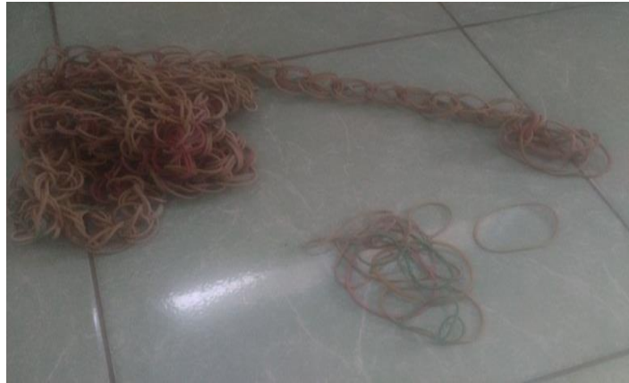
Gambar. Karet gelang

hingga ada pemain yang gagal lagi kemudian menggantikannya