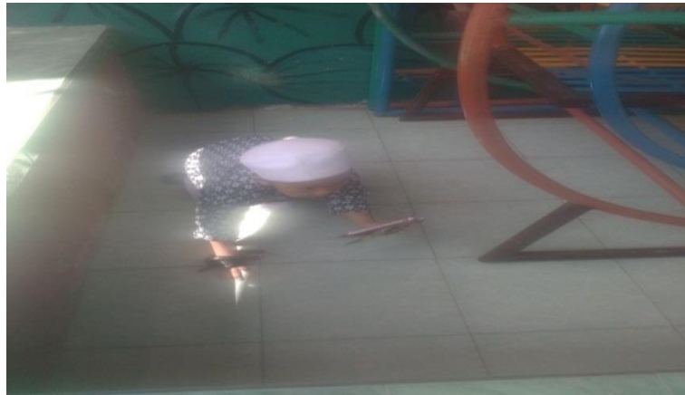
Gambar. pemain yang bersembunyi