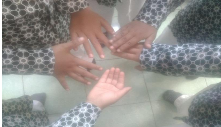
Gambar. Anak melakukan hompimpah