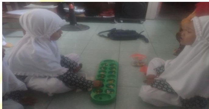
Gambar. pemain yang meletakkan biji congklak satu per satu