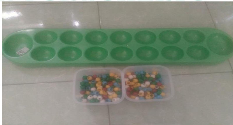
Gambar. Papan congklak dan biji plastik

Papan congklak terdiri dari enam belas lubang yang saling berhadapan dan dua lubang di kedua sisinya, biji yang di butuhkan untuk bermain congklak berjumlah 98 dan pada masing-masing lubang diisi 7 biji congklak kecuali dua lubang besar di kedua sisi. Setiap pemain memiliki satu lubang besar dan jika bermain maka lubang besar miliknya diisi satu biji. Biji yang digunakan dapat berupa cangkang kerang, batu-batuan, biji-bijian, kelereng, plastik. Permainan congklak di laksanakan pada hari Kamis, 4 april 2019 dengan Tema cinta tanah air. Pada kegiatan pembuka pukul 07.30-08.00 WIB anak-anak berdoa, bernyanyi, guru menjelaskan kegiatan hari ini dan menjelaskan permainan congklak serta cara melakukan permainan congklak. Pada kegiatan inti pukul 08.00-09.00 anak-anak masuk kelas setelah bermain petak umpet kemudian bermain congklak, istirahat pukul 09.00-09.30 dan kegiatan penutup pukul 09.30-10.00 anak kembali ke kelas untuk makan dan minum, kemudian menanyakan hari ini telah melakukan kegiatan apa saja, dan menanyakan perasaan hari ini, selanjutnya berdoa pulang. Adapun langkah-langkah dan aturan bermain congklak, yaitu: