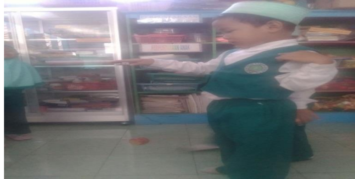
Gambar. Anak bermain yoyo