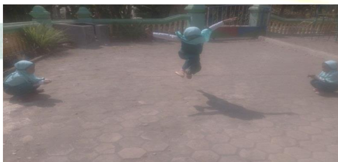
Gambar. Anak melompati tali