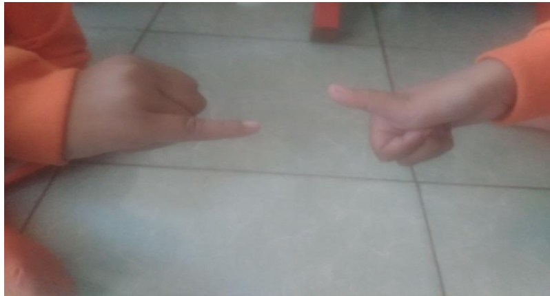
Gambar. Dua anak sedang bersuten.

kemudian menanyakan hari ini telah melakukan kegiatan apa saja, dan menanyakan perasaan hari ini, selanjutnya berdoa pulang. Adapun langkah-langkah dan aturan bermain suten, yaitu: