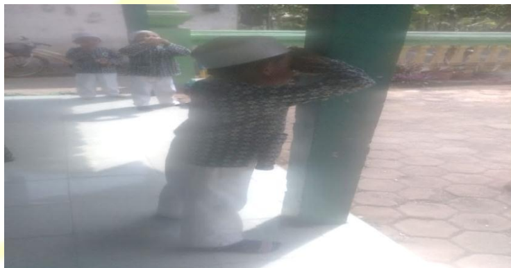
Gambar. Satu anak berjaga menunggu benteng