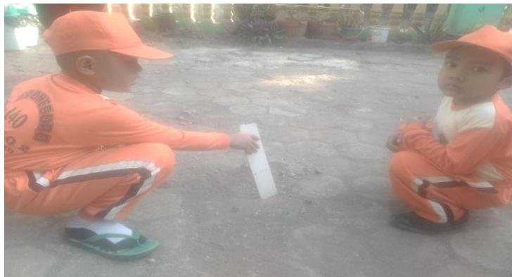
Gambar. Anak membuat lubang