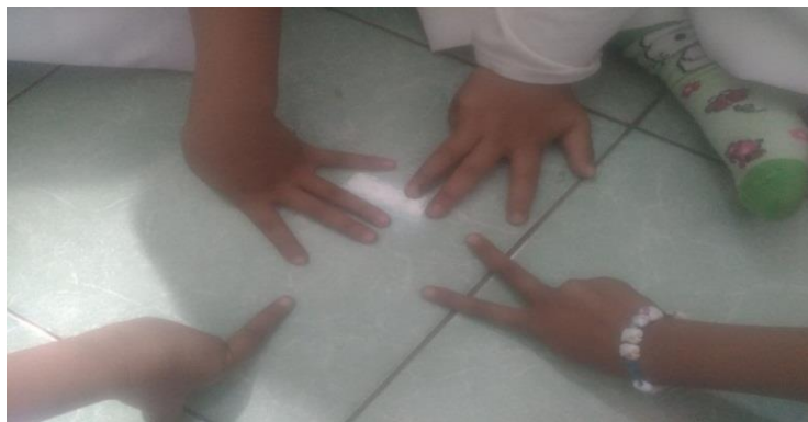
Gambar. Setiap anak mengajukan jumlah jari sesuai keinginan