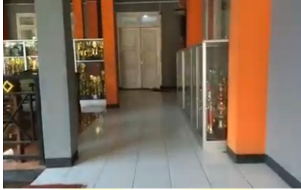
امام الإدارة المدرس في المدرسة الثانوية الحكومية بانوماس