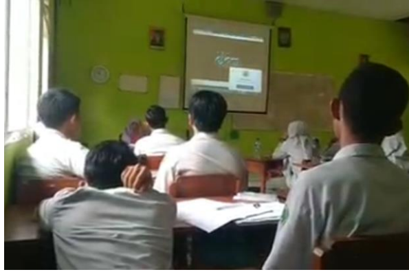
الملاحظة في الفصل