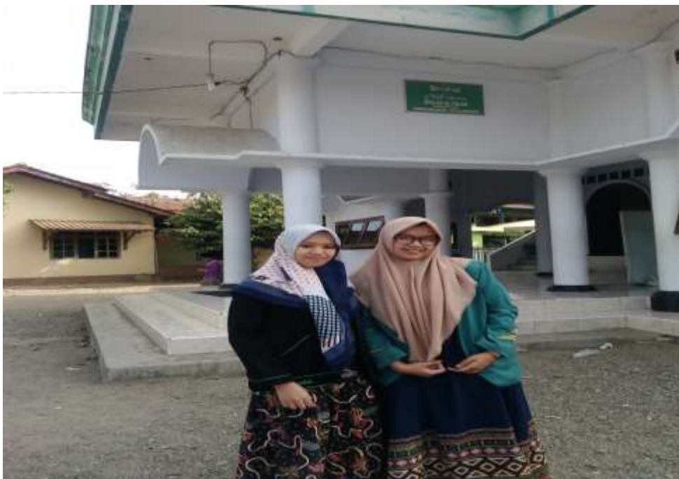
Foto usai melakukan Penelitian