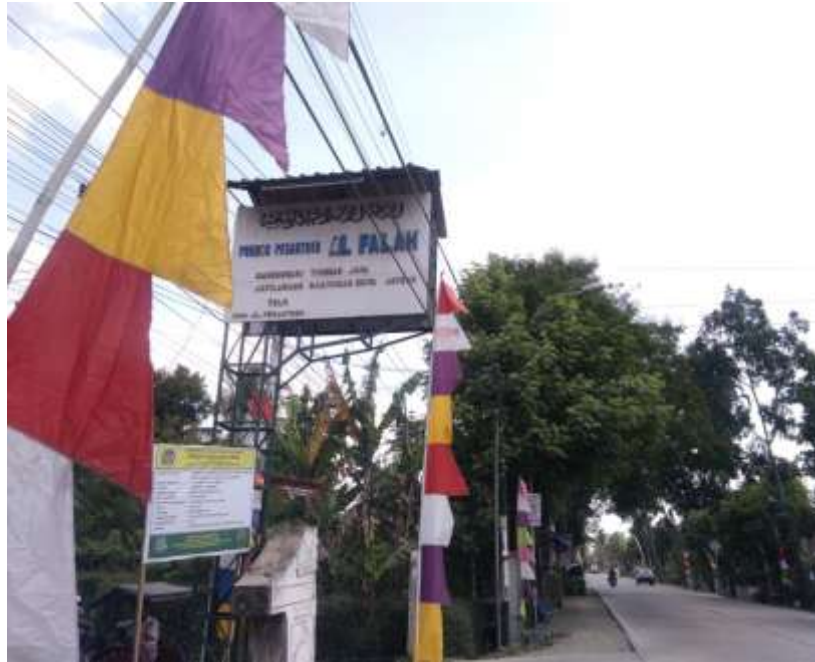
Papan nama Pondok pesantren Al-Falah Jatilawang Banyumas