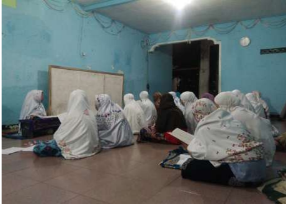
Kegiatan jam tambahan mengaji untuk santri baru