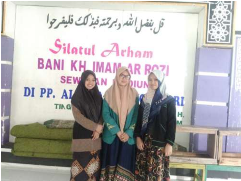
Foto bersama pengurus Pondok Pesantren Al-Falah