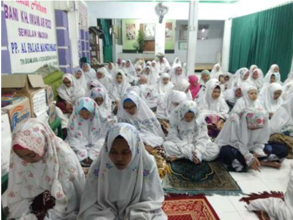
Kegiatan Mujahadah Santri Ba'da Sholat Isya