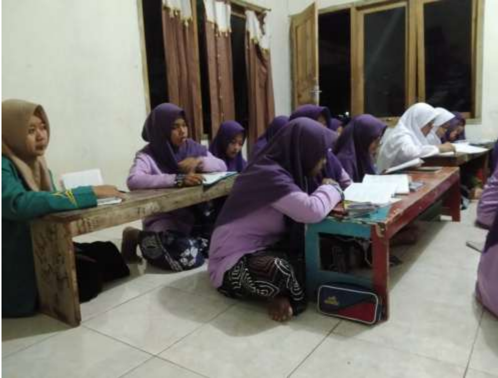
Observasi pembelajaran Kitab nahwu Syabrawi Syaf'i