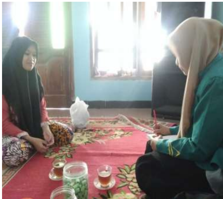
Wawancara dengan Lurah Pndok Pesantren Al-Falah Banyumas