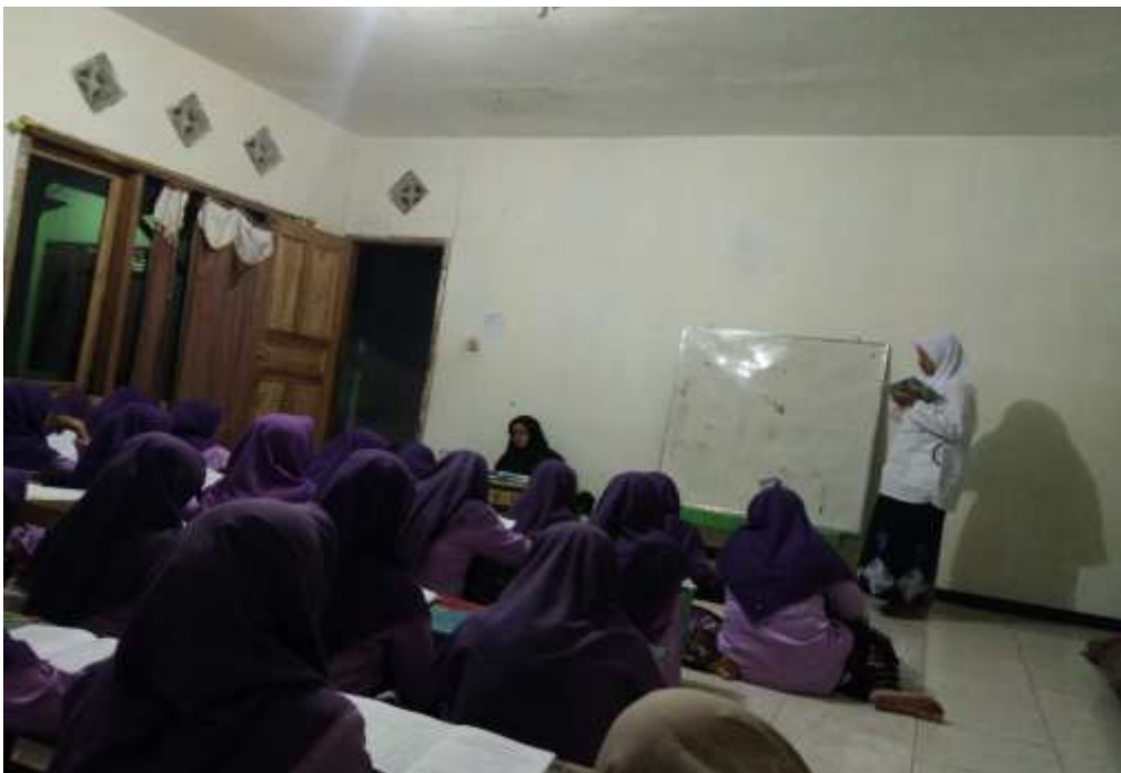
Salah satu santri membaca kitab nahwu Syabrawi Syafi'i di depan ustadzah dan santri lain