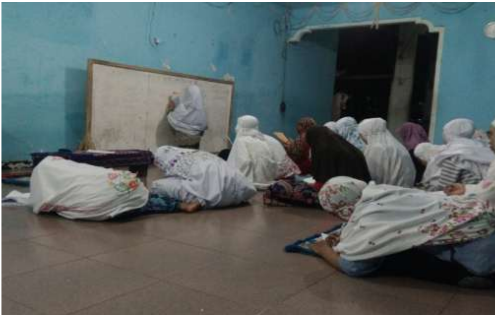
Kegiatan jam tambahan mengaji untuk santri baru