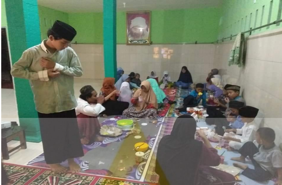
Pengajian rutin bulanan manaqib shyeh abdul qodir di AULA dalem pondok pesantren bani malik