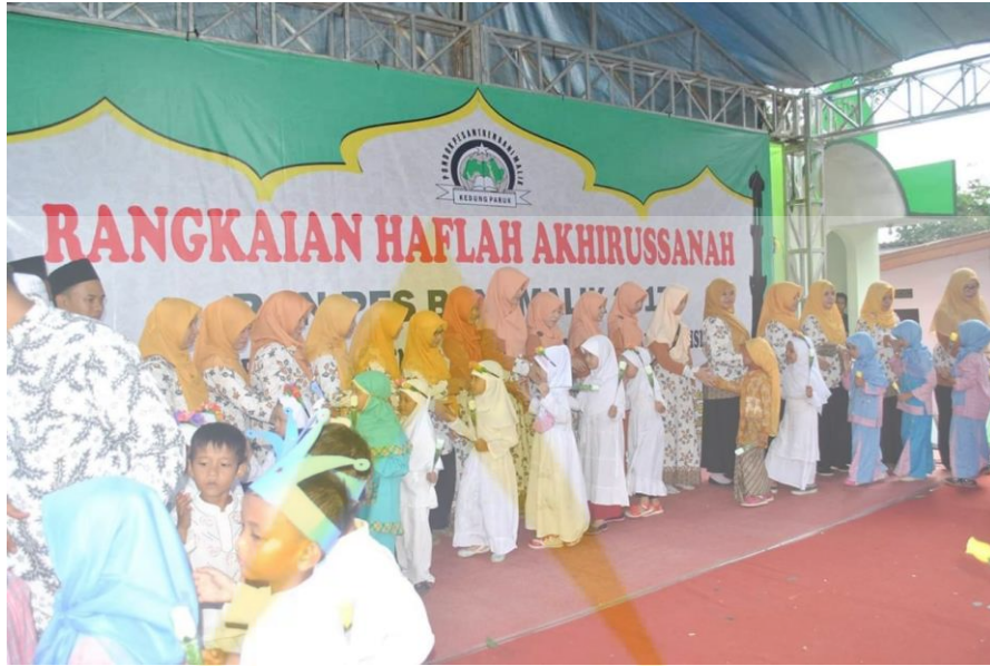
Rangkaian Haflah Akhirusanah TPQ BaniMalik

Berbuka bersama pengurus, Ustad dan santri TPQ bani malik