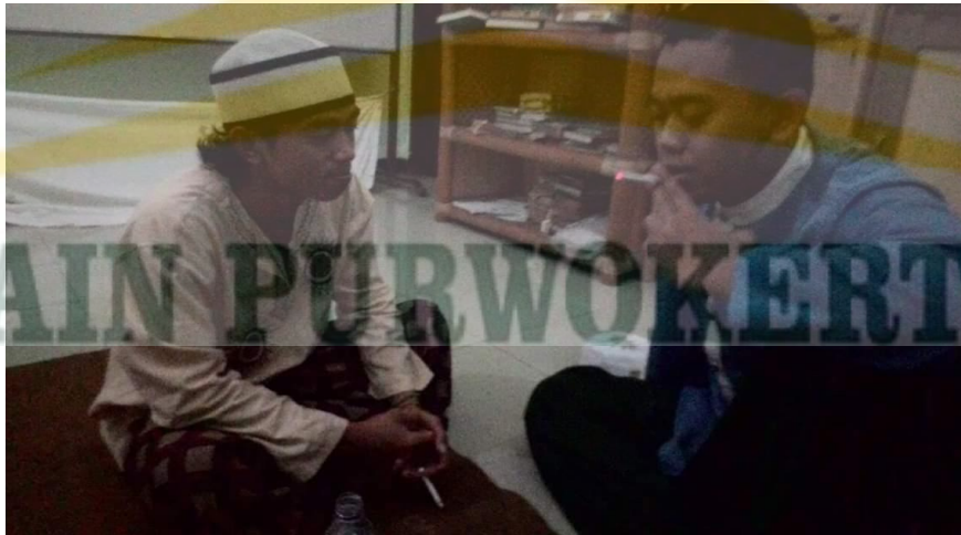
Wawancara dengan lurah pondok pesantren bani malik