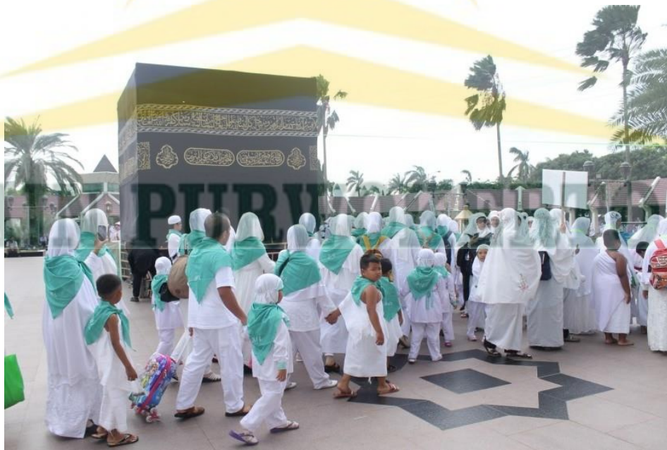
Manasik Haji Masyarakat Jamaah dan Santri TPQ Bani Malik