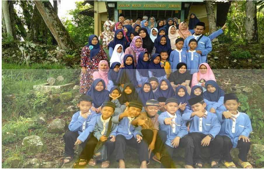
Ziaroh wali murid TPQ dan rombongan Masyarakat sekitar pondok pesantren Bani Malik