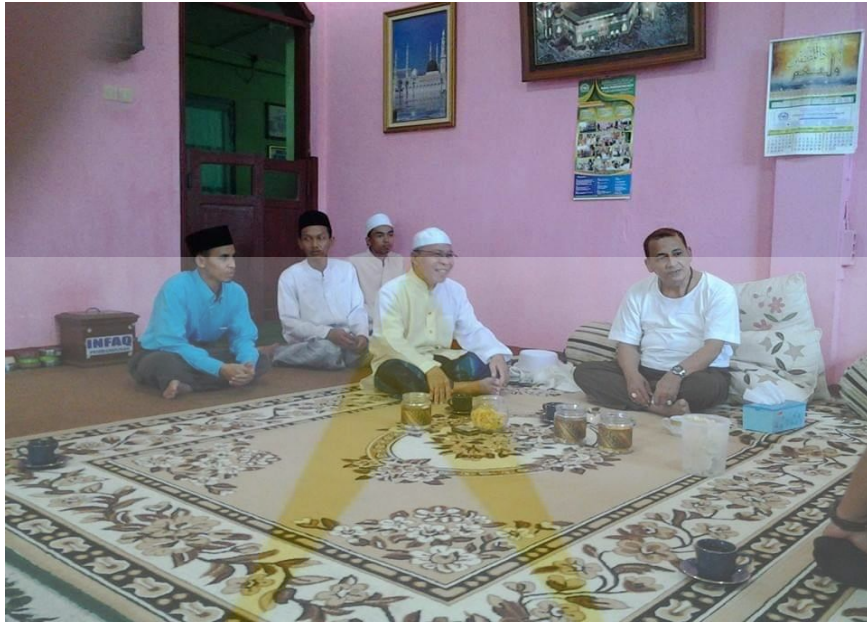
Wawancara dengan pengasuh pondok bani malik