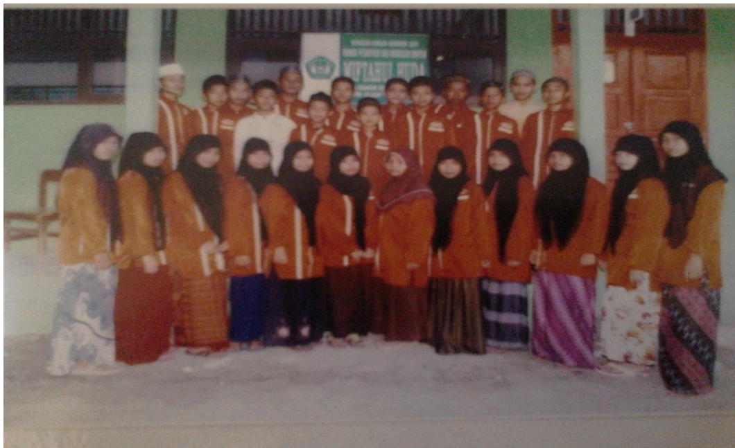
Gb. 20, “Santriwan/santriwati PP. Miftahul Huda”