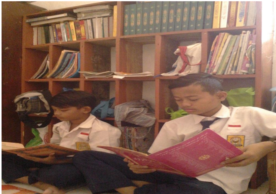
Gb. 18, “Mutalaah kitab kuning di kamar asrama”