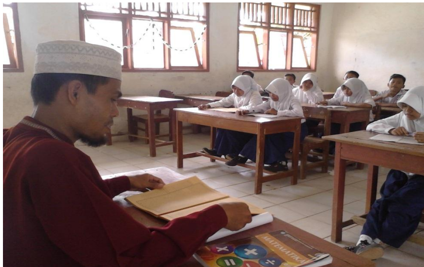
Gb. 06, "Guru dan siswa membaca ulang bacaan"