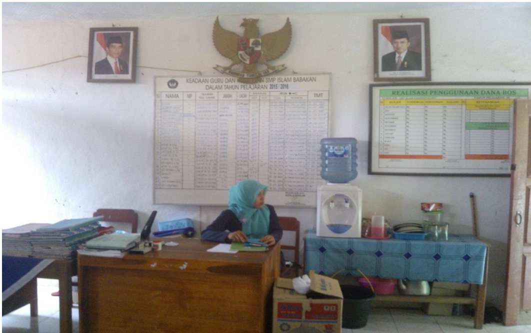
Gb. 09, “Ka. TU dan Ruang Kantor”