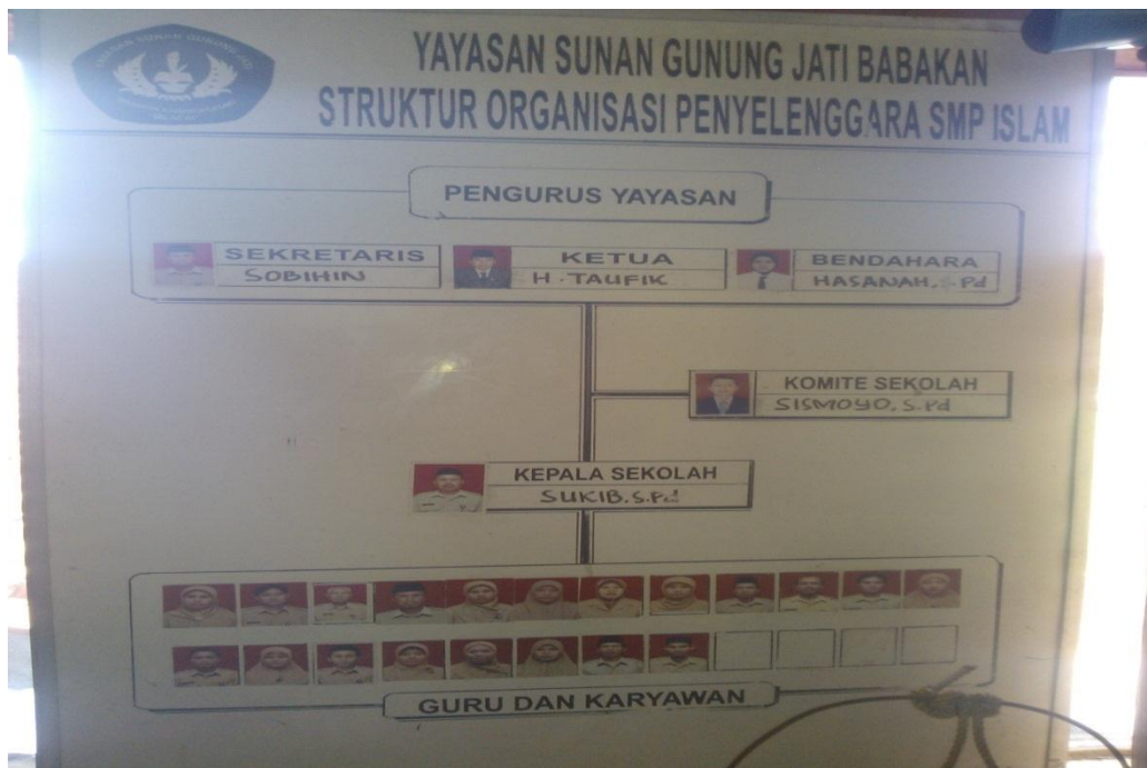
Gb. 15, “Struktur Organisasi Penyelenggara SMP Islam Babakan”