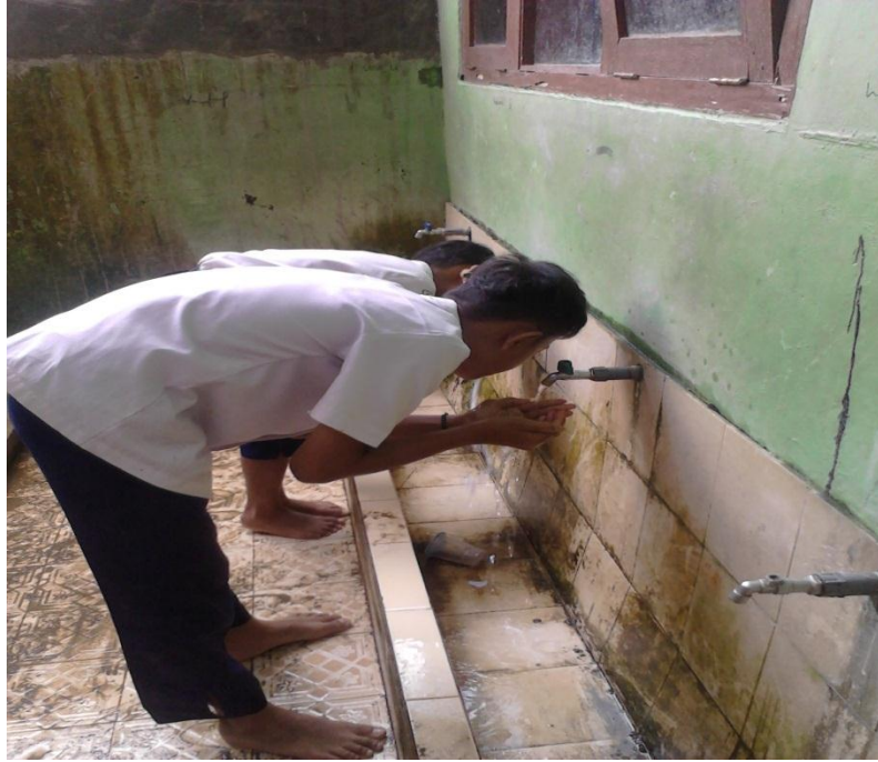
Gb. 11, "Tempat wudlu siswa putra"