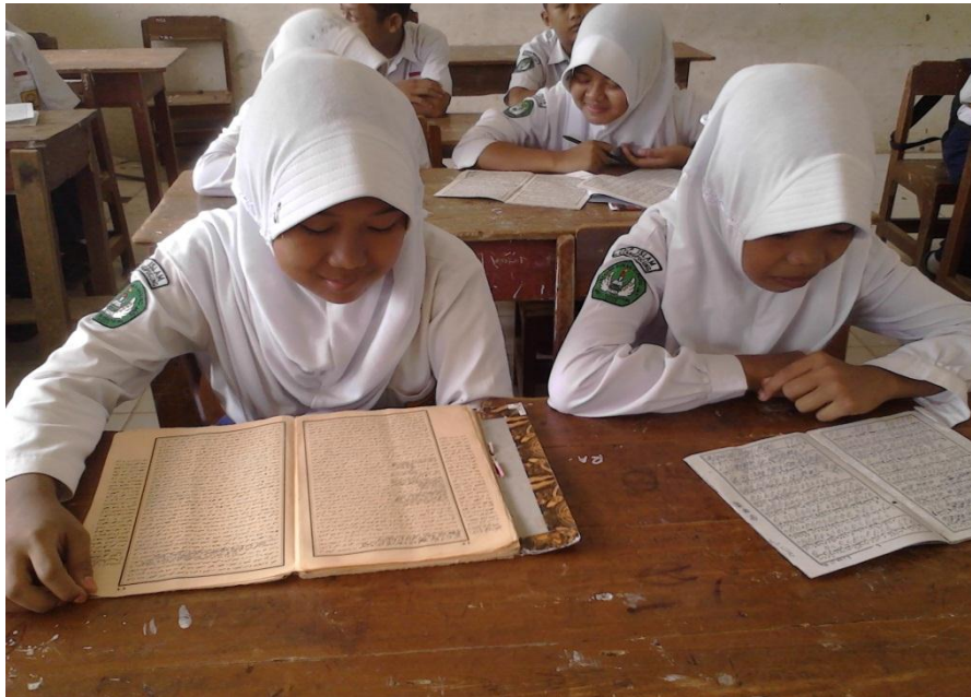
Gb. 04, “Siswi memperhatikan kitab”