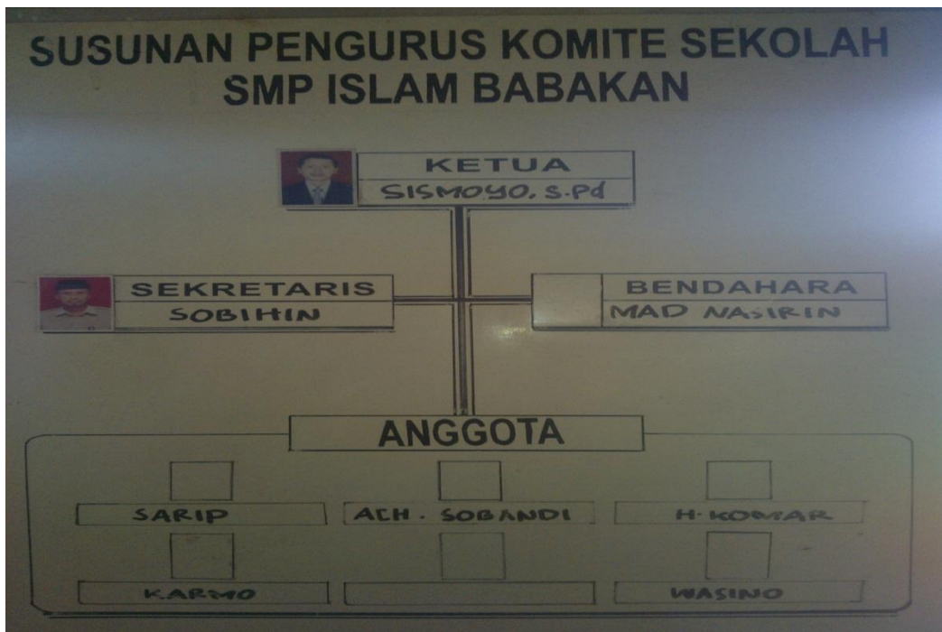
Gb. 13, “Struktur Susunan Pengurus Komite Sekolah SMP Islam Babakan”