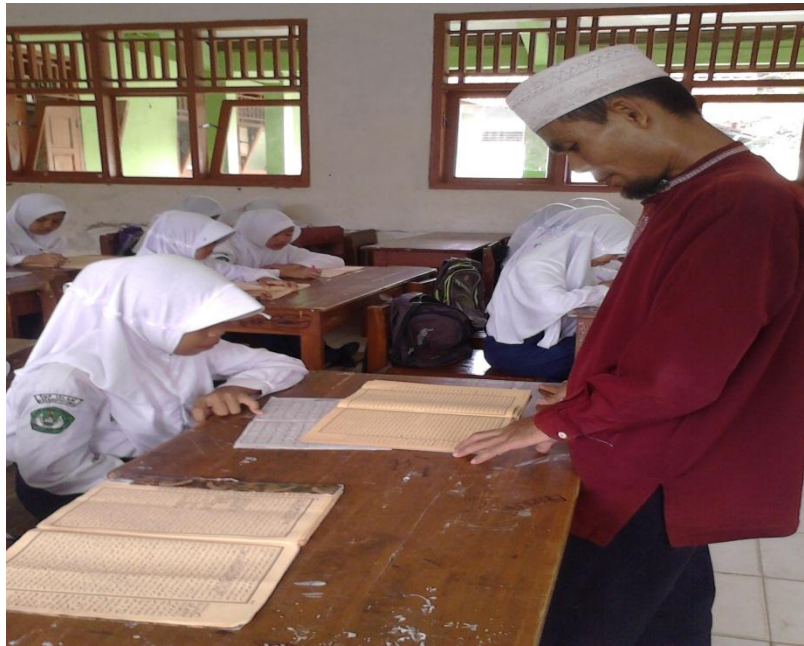
Gb. 17, “Praktek membaca kitab kuning”