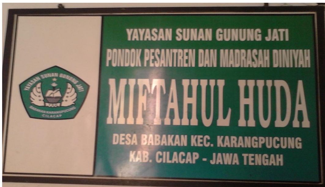
Gb. 19, “Plang Pondok Pesantren dn Madrasah Diniyah Miftahul Huda”