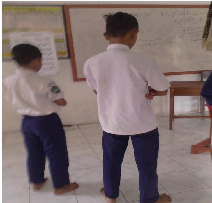
Gb. 12, "Siswa melaksanakan shalat sunnat dhuha di Mushalla"