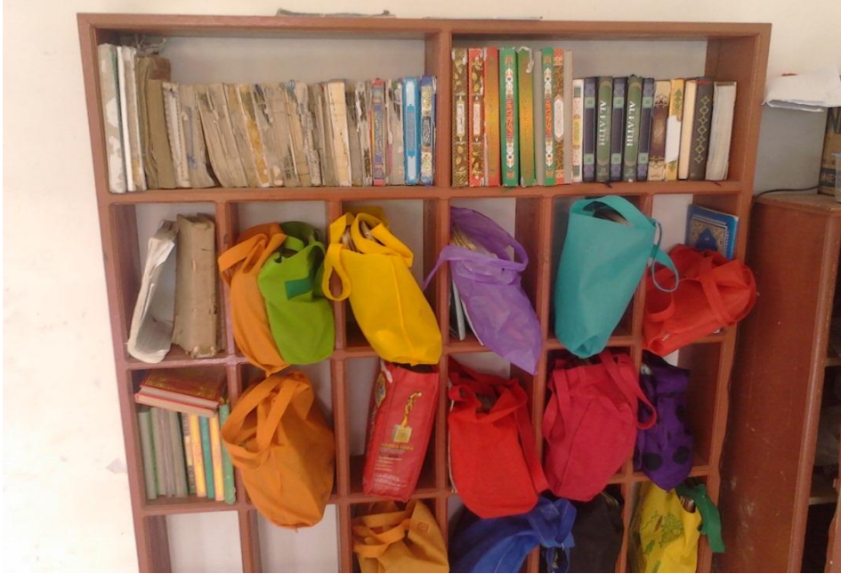
Gb. 07, “Rak mukena dan kitab di Mushalla sekolah”