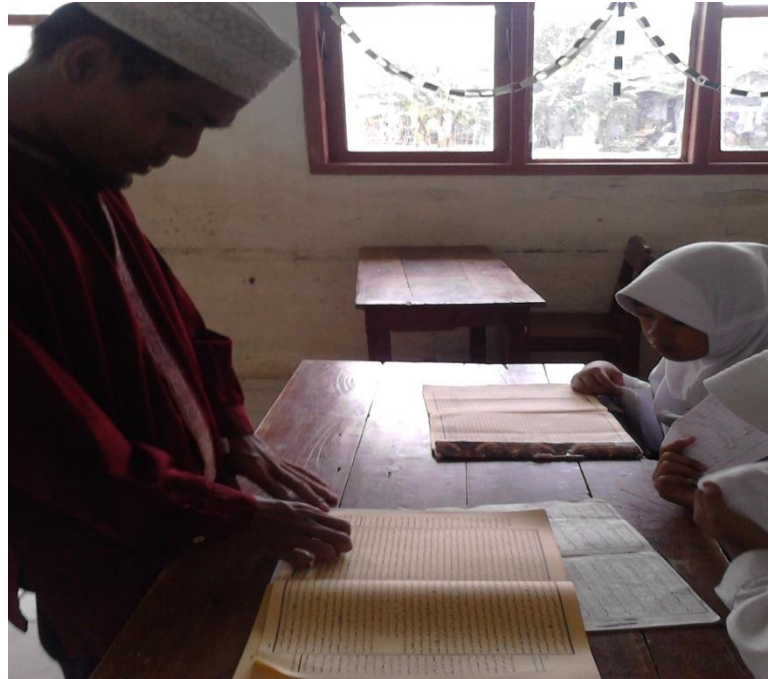
Gb. 05, "Guru memeriksa bacaan siswa"