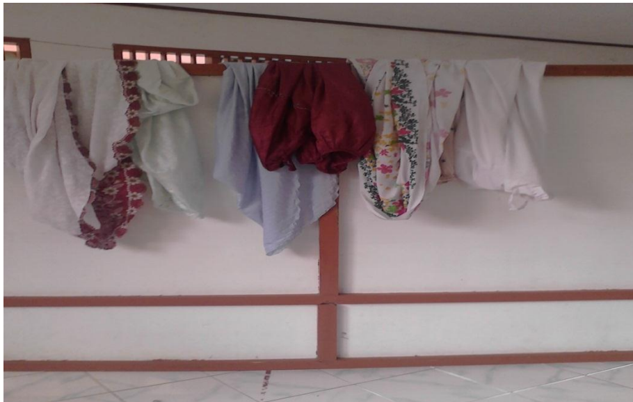
Gb. 08, “Sampiran mukena di dalam Mushalla”