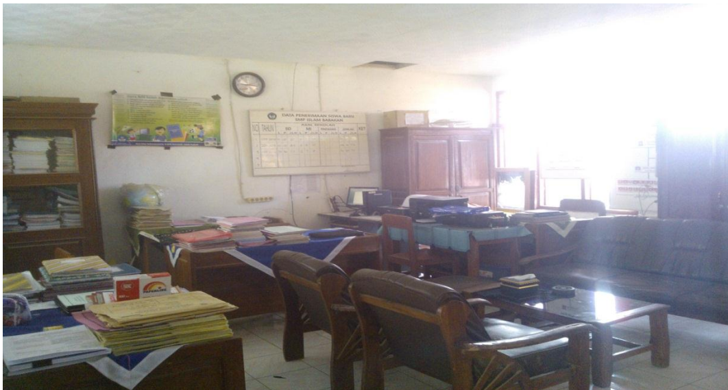
Gb.10, “Ruang Kantor Ketua Yayasan”