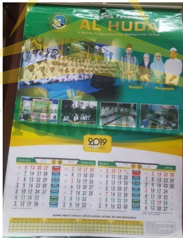
Dokumentasi Foto kalender SD IT Al-Huda Sidayu Kabupaten Cilacap