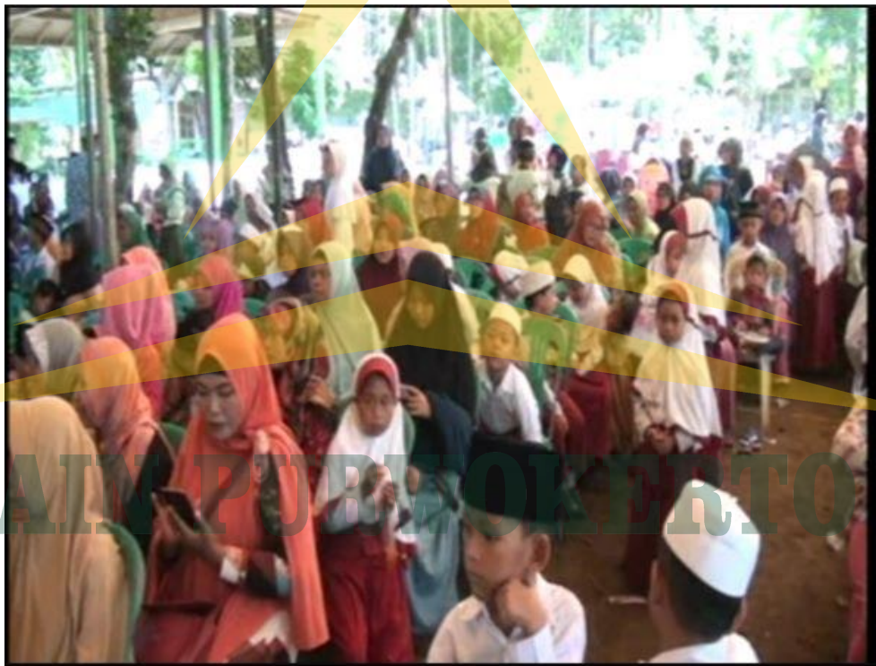
Dokumentasi Foto pertemuan wali murid dalam rangka Khotmil Qur'an