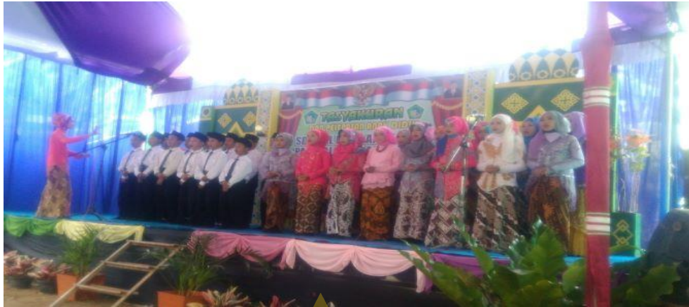
Dokumentasi Foto hasil penampilan siswa-siswi SD IT Al Huda Sidayu Kabupaten Cilacap