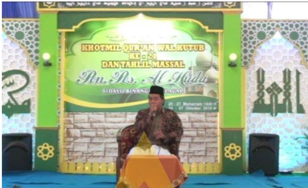
Dokumentasi foto acara khotmil Qur'an SD IT Al-Huda Sidayu