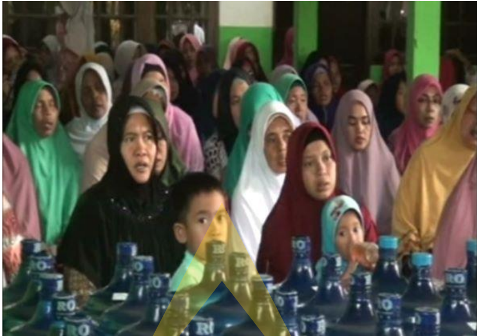
Dokumentasi Foto dalam rangka Muslimatan di SD IT Al Huda Sidayu