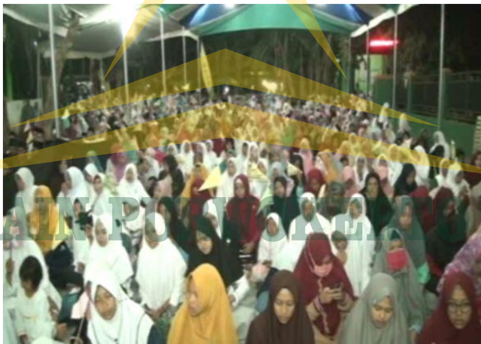
Dokumentasi Foto pengajian Tahlil Massal di SD IT Al-Huda Sidayu Kabupaten Cilacap