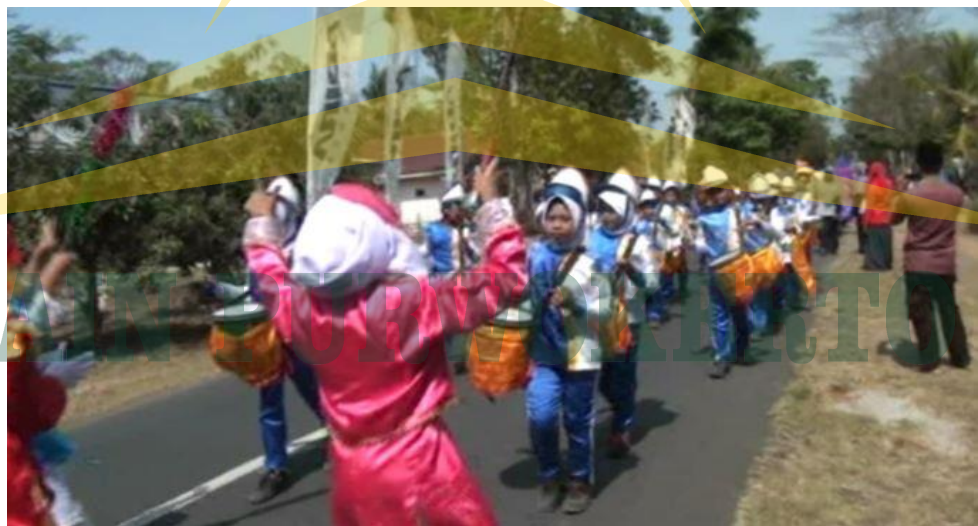
Dokumentasi Foto program Life Skill yang ada di SD IT Al Huda Sidayu