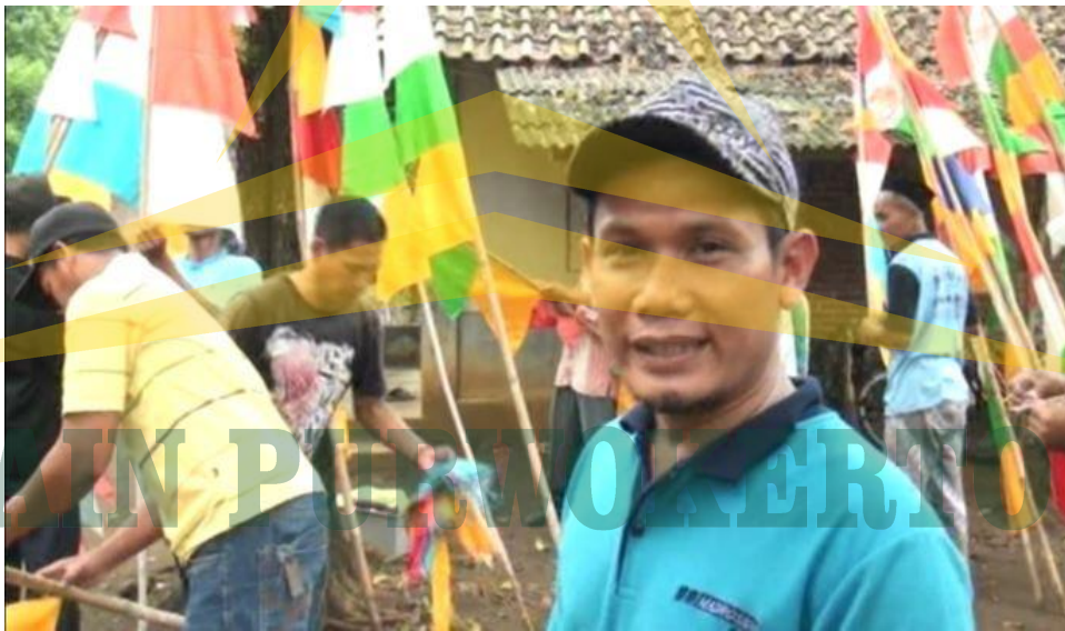
Dokumentasi Foto kerja bakti masyarakat dalam rangka mensukseskan haflah