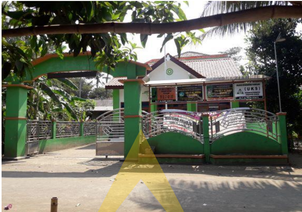
Dokumentasi foto gedung SD IT Al Huda Sidayu Kabupaten Cilacap