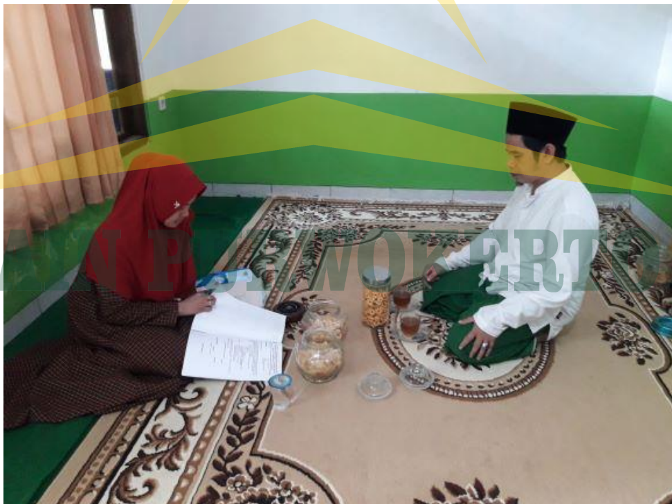
Dokumentasi foto wawancara dengan ketua yayasan SD IT Al Huda Sidayu Kabupaten Cilacap