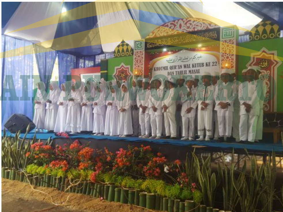
Dokumentasi Foto dalam rangka pengajian Muslimatan di SD IT Al Huda Sidayu