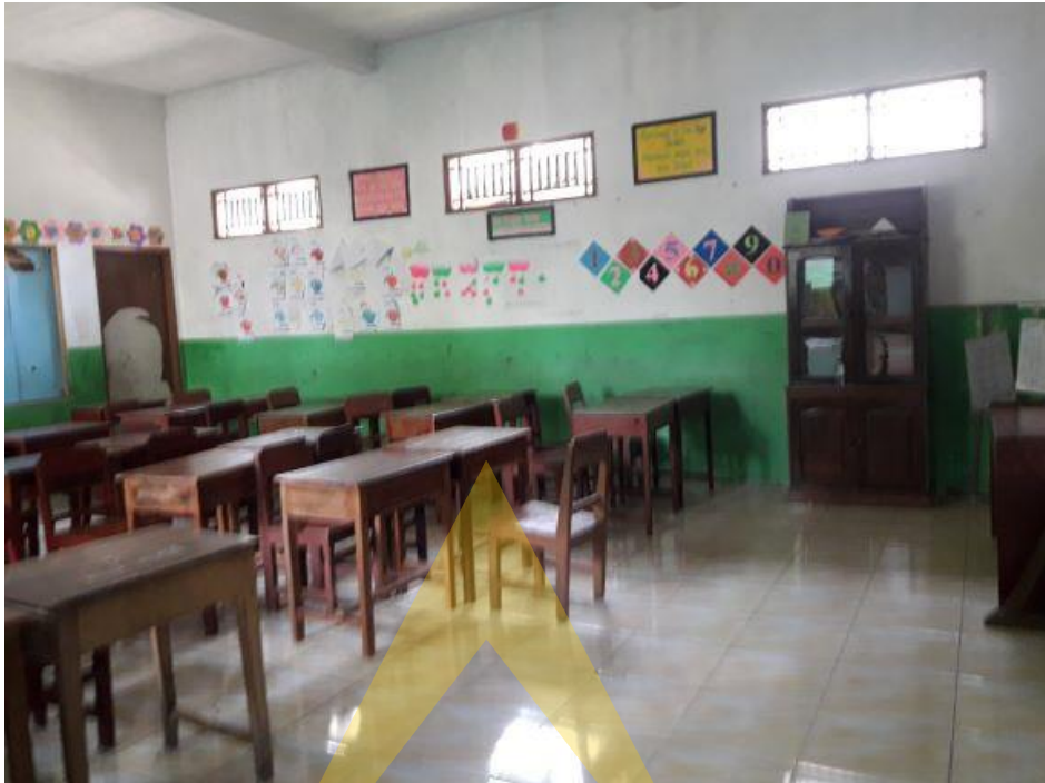
Dokumentasi Foto ruang kelas SD IT Al Huda Sidayu Kabupaten Cilacap