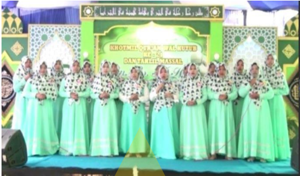
Dokumentasi Foto Penampilan Siswi SD dalam rangka Tahlil Massal