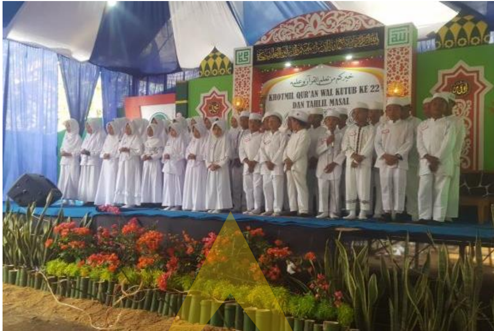
Dokumentasi Foto dalam rangka Khotmil Qur'an di SD IT Al Huda Sidayu