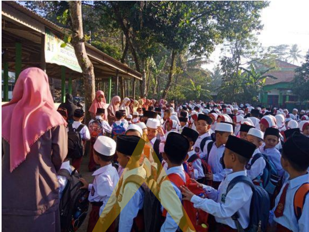
Dokumentasi Foto program unggulan pembiasaan baik di SD IT Al Huda Sidayu