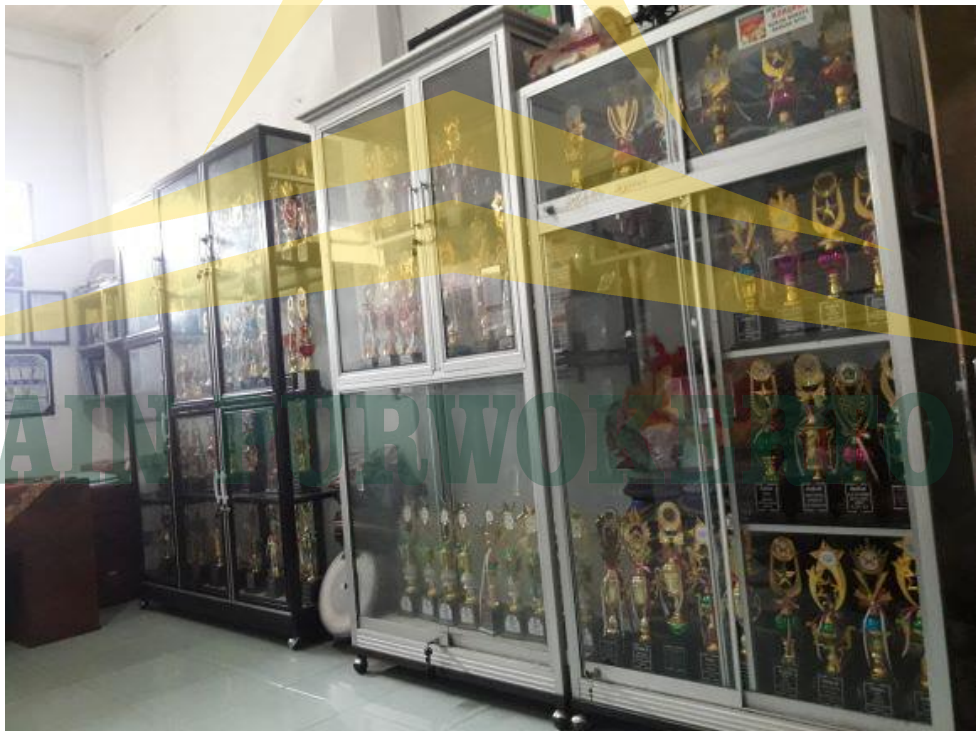
Dokumentasi piala hasil lomba-lomba di SD IT Al Huda Sidayu Kabupaten Cilacap