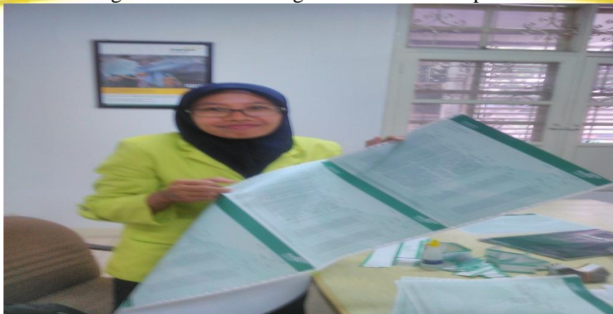
Dokumentasi penyusunan rekening.koran dan form Aplikasi untuk pembukaan Tabungan, Depoito dan Giro 22 Febuari 2016 pkl.15.00 wib.