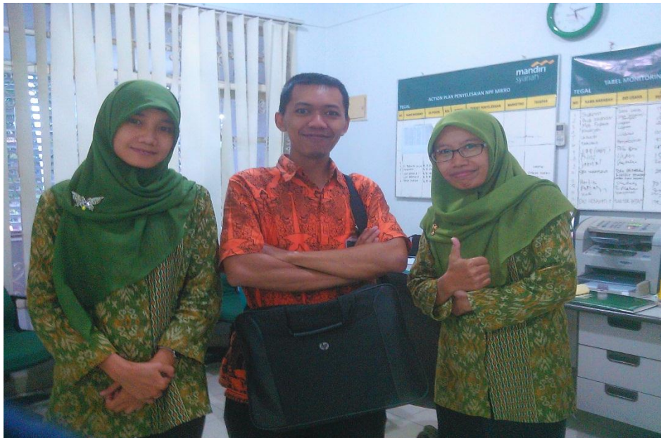
Dokumentasi Kegiatan dengan Bag. GSA BSM KC.Tegal 27 Februari 2016 pkl.16.45 wib.