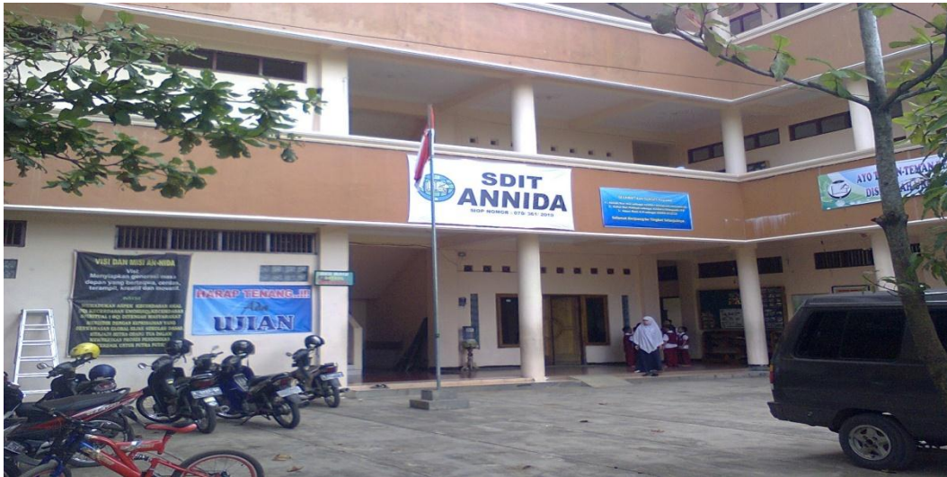
Gedung Sekolah Tampak Depan