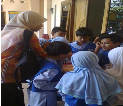
Siswa sedang bimbel