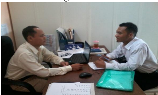
Wawancara dengan Guru PAI