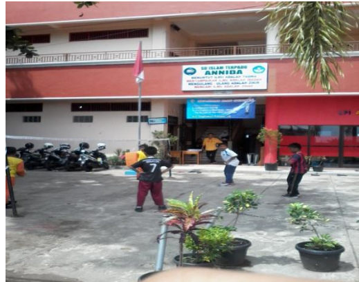
Siswa sedang praktek olahraga