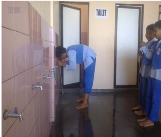
Siswa sedang wudhu