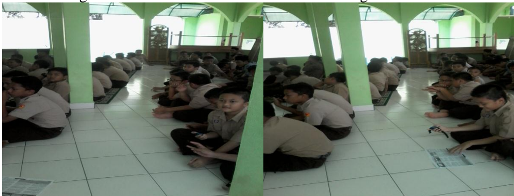
Siswa sedang persiapan sholat jumat