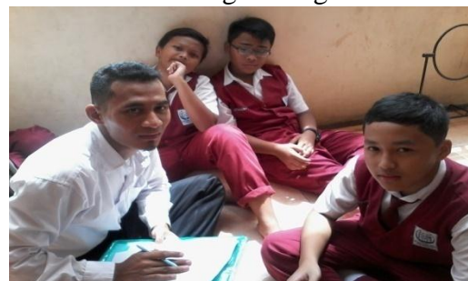
wawancara dengan Siswa