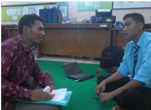
Wawancara dengan Waka Kesiswaan