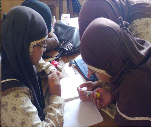
siswa sedang diskusi