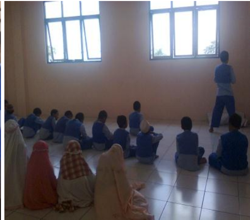
siswa persiapan sholat jamaah Duhur