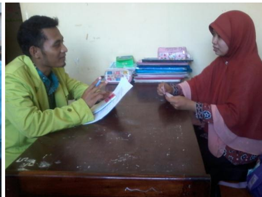
wawancara dengan dengan Guru BK