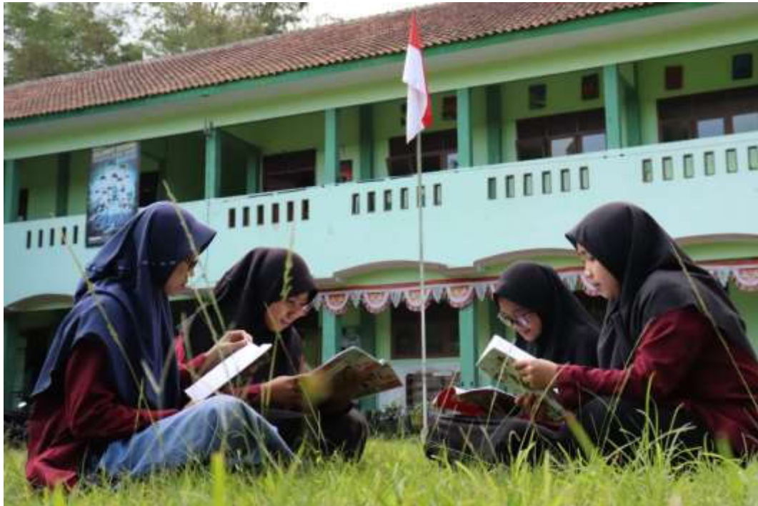
Foto kegiatan siswa saat berlatih berbicara bahasa Arab