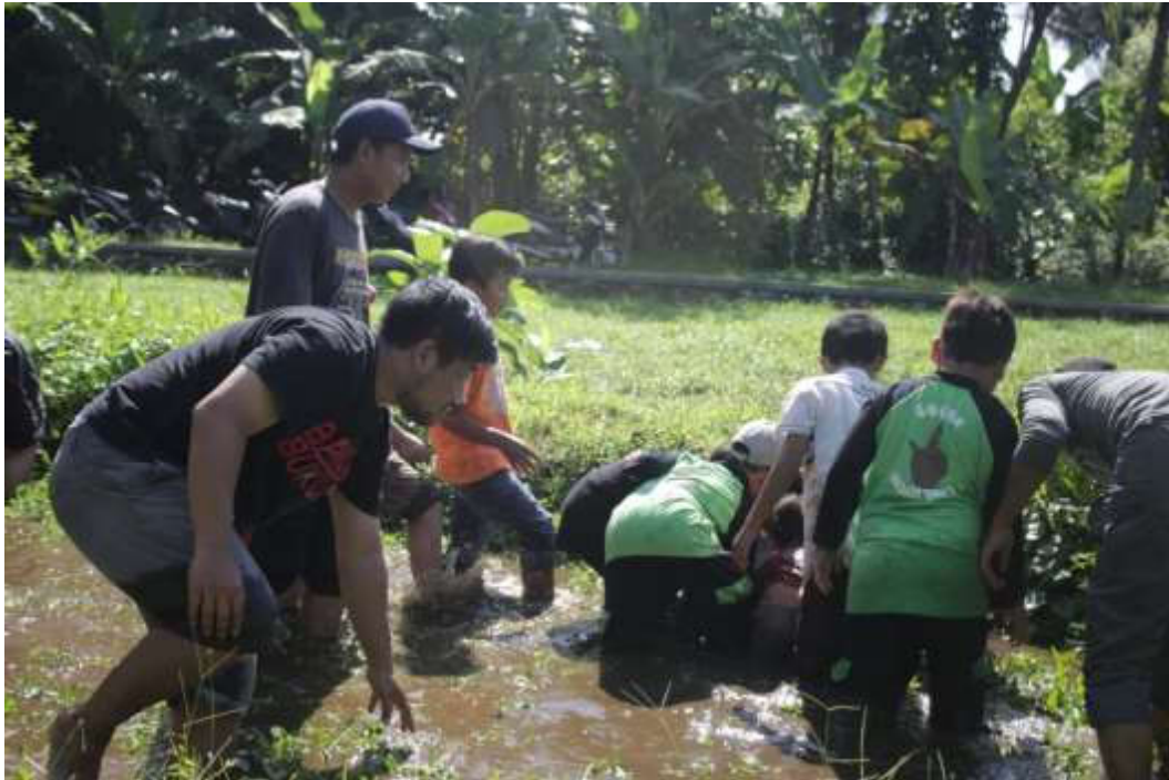
Foto. 6 Kegiatan Bersih-Bersih Lingkungan