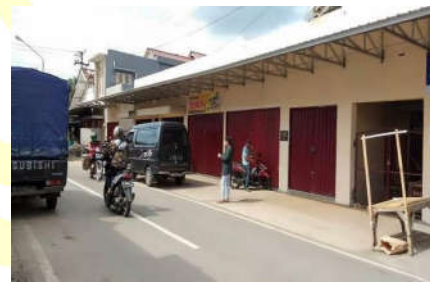
Gambar 4.2 Pasar Manis tampak depan 2019

Pengembangan dan pemeliharaan pasar juga seringkali muncul dari kerjasama antara BUMDes Cahaya Bumi Perkasa yang diwakili oleh kepala pasar dengan para pedagang pasar langsung. Kerjasama tersebut berupa pembuatan atau perbaikan los/lapak/kios yang dibiayai oleh pedagang sendiri, seperti kios yang ada di pinggir pasar dekat jalan raya. Untuk perbaikan kios-kios pedagang, BUMDes Cahaya Bumi Perkasa menawarkan kepada para penjual khususnya pedagang pakaian untuk memperbaiki lapak mereka dengan pilihan pembuatan kios. Pembuatan atau perbaikan kios bertujuan agar penjual pakaian setiap harinya tidak