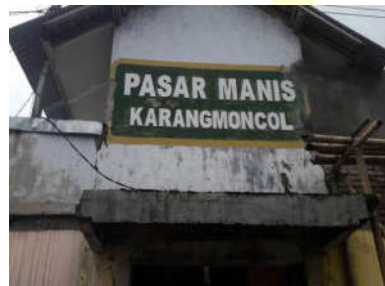
Gambar 4.1 Pasar Manis tampak depan 2018

Tidak hanya perbaikan toilet, BUMDes Cahaya Bumi Perkasa juga menata ulang lapak pedagang. Sebelumnya lapak pedagang tidak beraturan yang menyebabkan pasar menjadi sempit dan berdesak-desakan. Pedagang banyak berjualan di pintu pasar yang menyebabkan akses masuk para pengunjung pasar menjadi sulit. Terdapat penumpukan pedagang di depan pintu masuk, dan pengunjung memilih membeli di bagian luar pasar. Hal ini menyebabkan lapak-lapak yang ada di dalam pasar sepi pengunjung. BUMDes Cahaya Bumi Perkasa melakukan penataan ulang terdapat lapak pedagang. Penataan ulang lapak berdasarkan jenis yang barang yang mereka jual. Hal ini bertujuan agar pembeli lebih mudah menemukan barang kebutuhan dan menghindari berdesak-desakan.