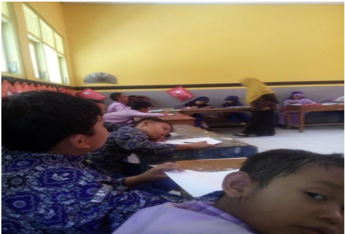
Gambar 4.3 Pembelajaran Yang Tidak Menggunakan Media Gambar

Kegiatan pembelajaran konvensional diberikan kepada peserta didik yang pembelajarannya tidak menggunakan media gambar. Pembelajaran konvensional adalah pembelajaran yang dalam proses belajar mengajarnya menerapkan metode ceramah. Peserta didik lebih banyak mendengarkan penjelasan guru di depan kelas pada pembelajaran konvensional. Guru saat memulai pembelajaran harus memancing pengetahuan peserta didik mengenai materi cerita pendek yang sedang diajarkan. Saat guru menjelaskan materi dan beberapa peserta didik terlihat bosan, kurang semangat dan berbicara sendiri dengan temannya. Peserta didik yang ditegur tetap nekat tidak mendengarkan penjelasan guru. Terlihat pada gambar 4.3. Ada peserta didik yang tidak memperhatikan penjelasan dari guru.