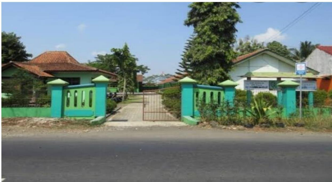
Gambar 4.1. Lokasi SD Negeri 03 Rawalo

Berdasarkan kondisi geografis SD Negeri 03 Rawalo dengan luas tanah bukan milik 2779 m 2 dapat dilihat pada gambar 4.1 .