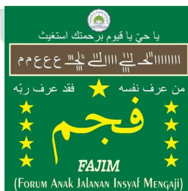
Gambar 1.1 Logo Forum Anak Jalanan Insyaf Mengaji

Logo ini digunakan sebagai identitas organisasi atau tanda pengenal. Simbol yang ada pada logo Forum Anak Jalanan Insyaf Mengaji mengandung banyak filosofi dan makna.