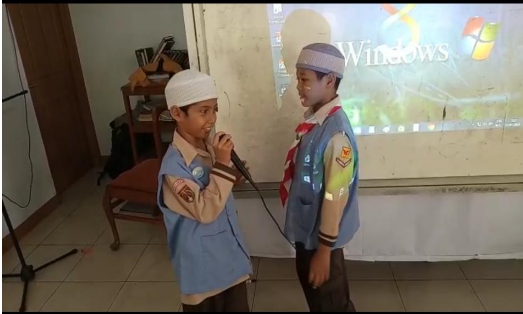
Foto kegiatan siswa berlatih berbicara bahasa Arab